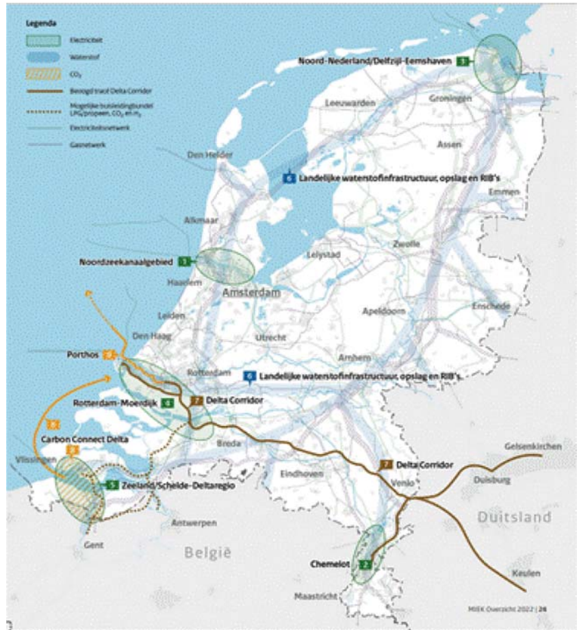
Figuur 2: Totaalkaart Meerjarenprogramma Infrastructuur Energie en Klimaat (MIEK-projecten) 1