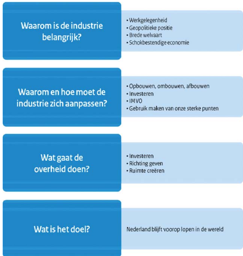
Figuur 1: Essentie Strategisch en Groen industriebeleid

De Minister van Economische Zaken en Klimaat, M.A.M. Adriaansens