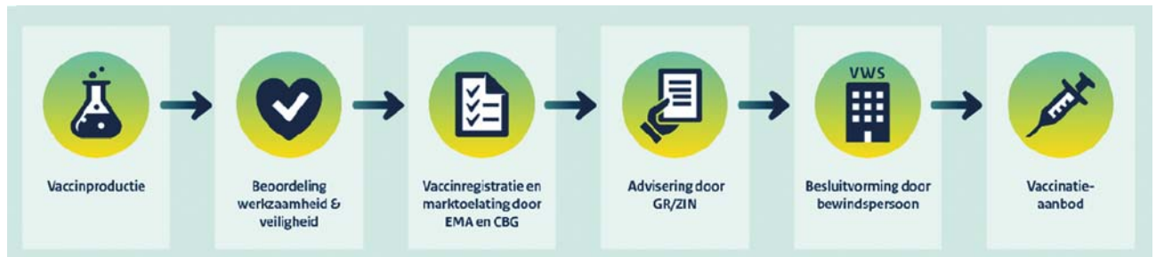
Figuur 4 Van productie tot prik

Het is en blijft van belang om waar mogelijk in te zetten op het verkorten van deze tijd. Om de gezondheidswinst van vaccins optimaal te benutten is het ten eerste van belang dat onderzoek, ontwikkeling, productie en innovatie van vaccins gestimuleerd wordt. Dit thema wordt opgepakt in de beleidsagenda pandemische paraatheid en ook via de farmaceutische strategie voor Europa, die door de Europese Commissie is gepubliceerd. 10, 11 Zo wordt onderzocht of en hoe navolging gegeven kan worden aan het advies van de special envoy vaccins over behoud en vergroten van productiecapaciteit in Nederland. Ook wordt gekeken of het FAST initiatief benut kan worden voor versnelling van ontwikkeling en toepassing van nieuwe therapieën en vaccins via publiek-private samenwerking in de Topsector Life Sciences and Health.