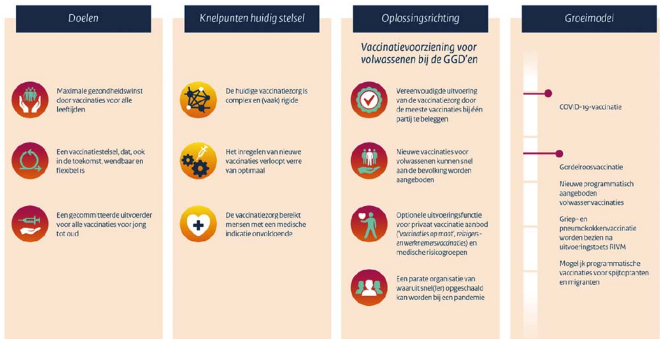
Figuur 1 Toekomstgericht vaccinatiestelsel

Ik vraag het RIVM om een uitvoeringstoets te doen. De uitvoeringstoets richt zich op de vraag op welke wijze de vaccinatievoorziening ingericht moet worden. Ook zal deze uitvoeringstoets zich richten op het groeimodel; welke vaccinaties kunnen, onder welke randvoorwaarden,