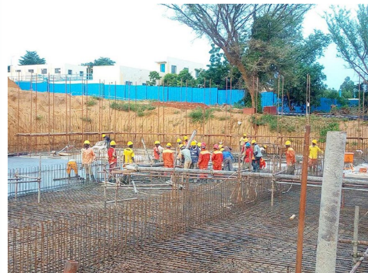
Invest International versterkt onze internationale concurrentiepositie.

Financiering is voor bedrijven van essentieel belang om zaken te doen in het buitenland, maar banken zijn vaak terughoudend als het gaat om financiering en verzekering van projecten in risicovolle markten. Het brede financieringsaanbod vanuit de overheid kan dan een oplossing bieden. Via Invest International en Atradius DSB ondersteunt het kabinet Nederlandse ondernemers die in het buitenland willen investeren met financiering en verzekeringen. In het bijzonder is hier een belangrijke rol weggelegd voor Invest International, dat is opgezet volgens de één-loket-gedachte. 28 Het MKB wordt binnen Invest International onder andere bediend via het Dutch Good Growth Fund (DGGF) en Dutch Trade and Investment Fund (DTIF). Zo worden Nederlandse bedrijven geholpen internationale orders te winnen, te voldoen en betaald te krijgen. Het kabinet blijft hierop inzetten, en stimuleert ook de ontwikkeling van innovatieve financieringsvormen, waar mogelijk samen met private partijen. Het doel is dat geen enkele gezonde, duurzame en kansrijke business case van een Nederlands bedrijf op een buitenlandse markt mislukt door gebrek aan financiering of verzekering.