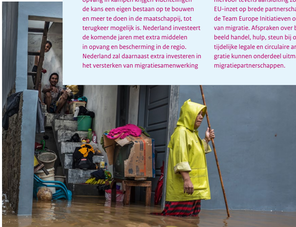
Overal ter wereld zijn de gevolgen van klimaatverandering zichtbaar.

met belangrijke landen van herkomst en transit. Prioriteiten zijn de bescherming van de mensenrechten, het terugdringen van irreguliere migratie, het tegengaan van mensensmokkel en -handel, beter grensbeheer en het bevorderen van terugkeer en herintegratie. Vanwege de grotere schaal en slagkracht zal Nederland hiervoor tevens aansluiting zoeken bij de EU-inzet op brede partnerschappen en de Team Europe Initiatieven op gebied van migratie. Afspraken over bijvoorbeeld handel, hulp, steun bij opvang en tijdelijke legale en circulaire arbeidsmigratie kunnen onderdeel uitmaken van migratiepartnerschappen.