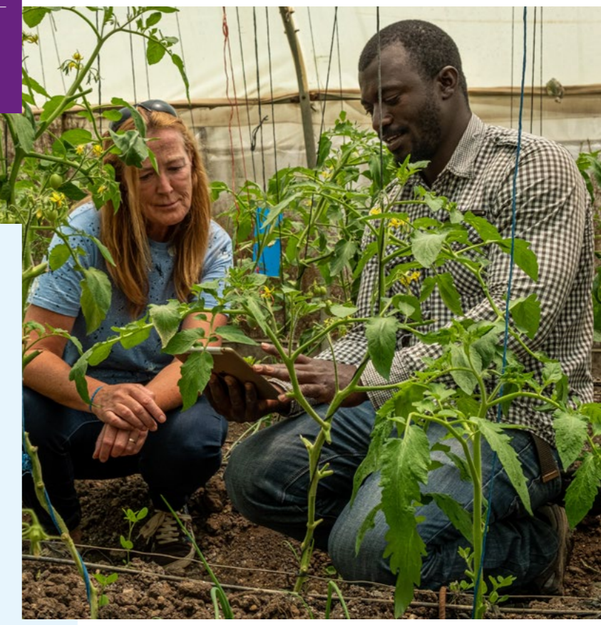
Nederlanders hebben kennis en kunde op het gebied land en tuinbouw om voedselonzekerheid terug te dringen.

“Met een gezamenlijk belang helpen overheid en bedrijven elkaar binnen de internationale handel- en productieketens om concrete stappen vooruit te zetten op het gebied van digitalisering en duurzaamheid.”