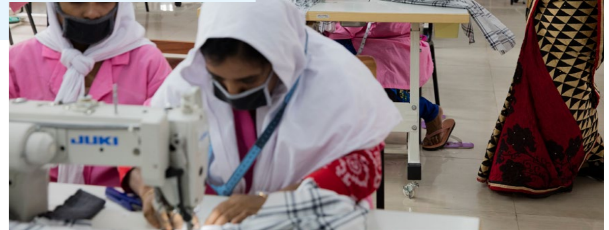
Nederlandse bedrijven zien het belang van IMVO voor hun onderneming.