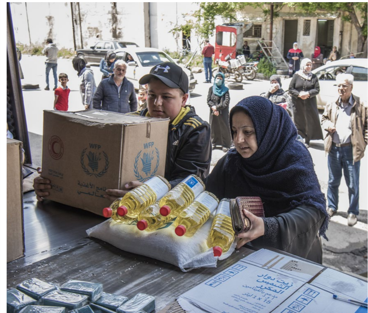
Gevolgen van oorlog zijn groot voor kwetsbare mensen elders.