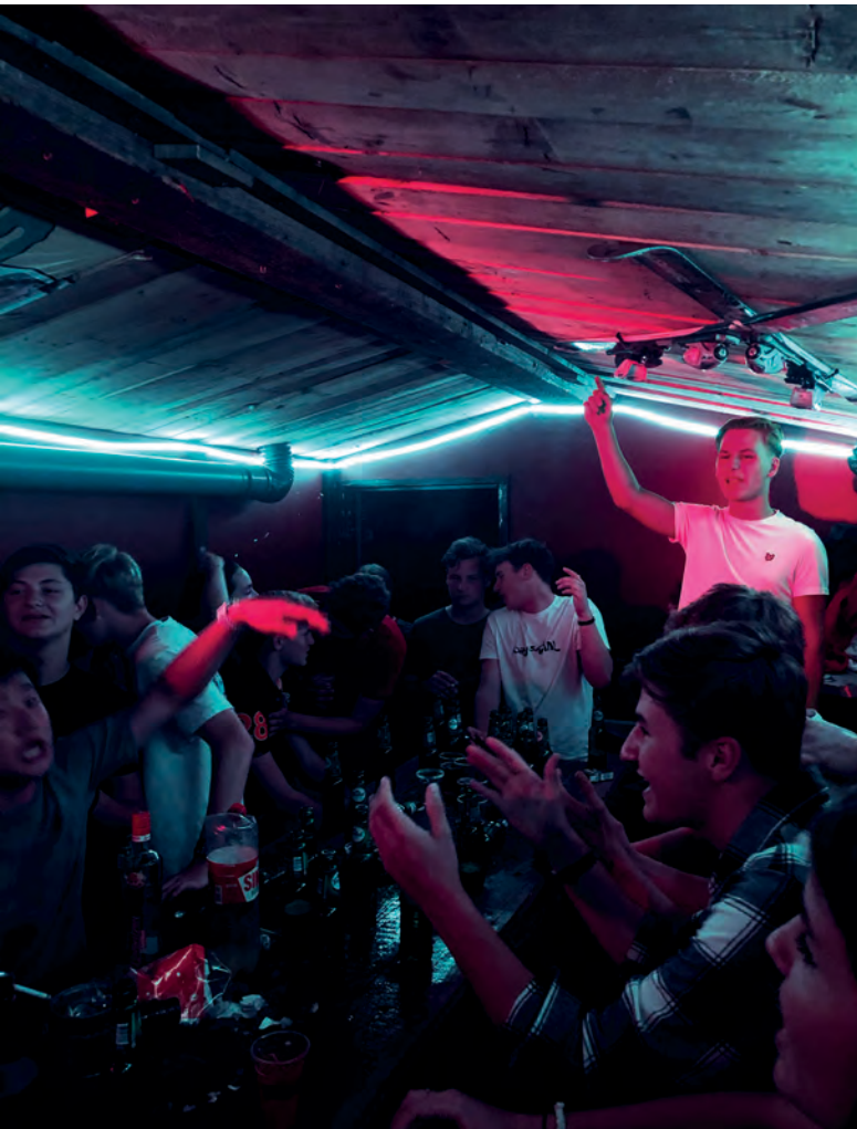
Titel: Vriendenkeet

“Weet je hoe vet het was, toen je 15 was, dat je toch binnenkwam [in het café] terwijl je eigenlijk niet mocht. Dat waren de vetste tijden.” (mbo4, BOL)