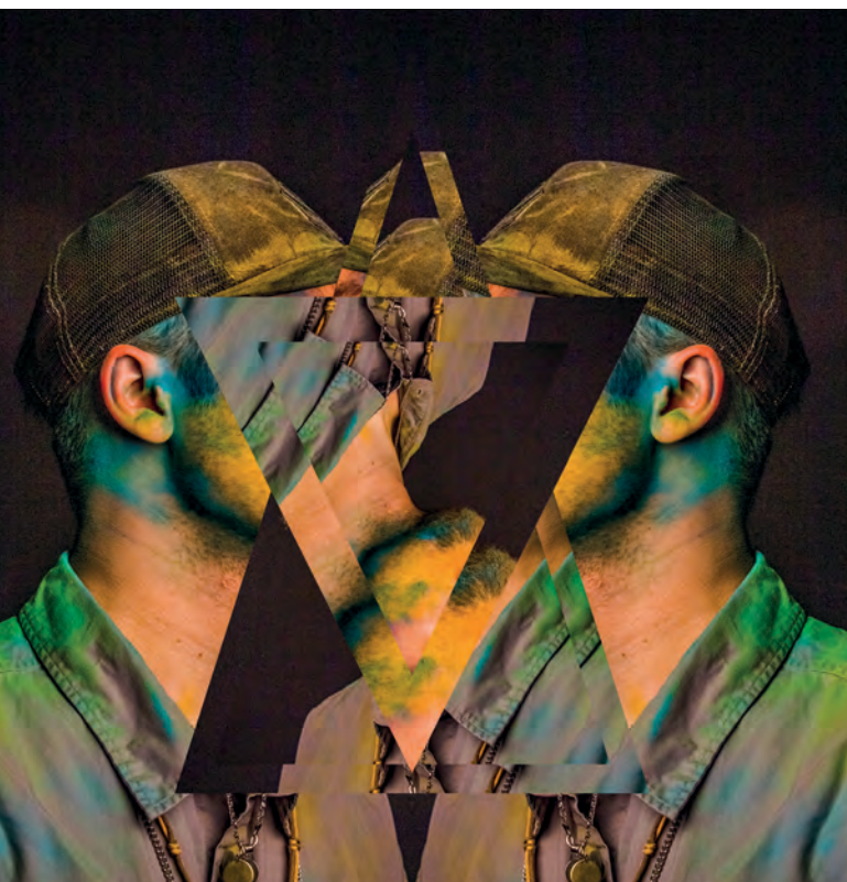
Titel: Unspoken Colours

De financiële consequenties van de epidemie zorgden voor zorgen en spanningen. Sommige studenten, of hun familieleden, verloren hun (bij)baan. Dit was extra lastig voor studenten die al met de stress van armoede leefden. Een moeder (mboz, BOL) van een vijf maanden oude baby vertelt dat haar werk in een kledingwinkel wegviel tijdens de epidemie. Op dit moment heeft ze veel moeite met haar financiën. Vooral de kinderopvang is duur. Een andere student herkent dit verhaal. Hij is zijn baan verloren en zegt: