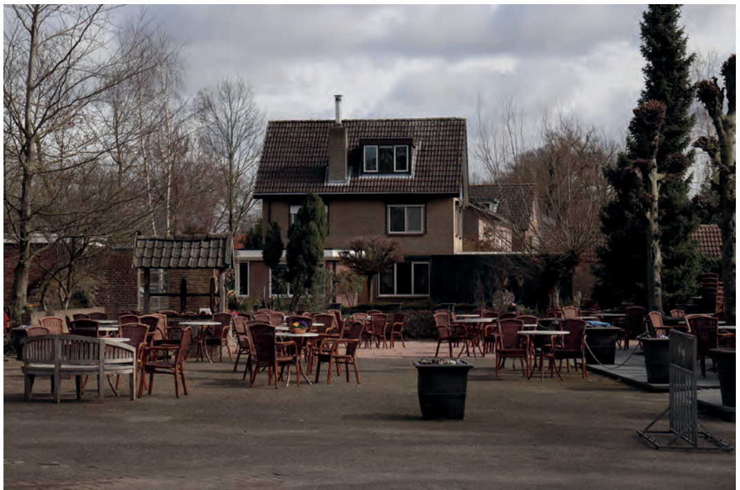
Titel: Een leeg terras – ‘Niet zomaar terrasje kunnen pakken’

“Ik wil mijn verjaardag niet vieren met 4 mensen, ik word 18, daaagg. ☹️” (mbo4, BOL)