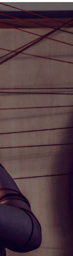
Titel: De draad kwijt

Belangrijk om op te merken is dat de meeste studenten een negatief effect ervaren van de epidemie, maar de impact was niet constant. Studenten bewegen mee met de coronamaatregelen en laten veerkracht zien; in periodes met weinig maatregelen voelen studenten zich beter dan in periodes met veel maatregelen. Studenten benadrukken dat hun gevoel per maand, week of zelfs per dag kon verschillen.