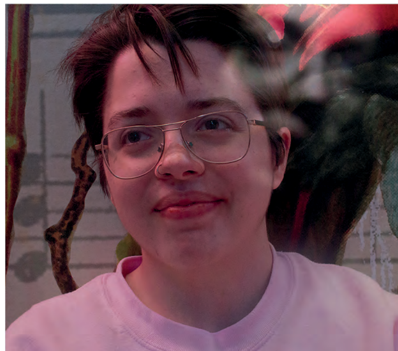
Titel: People can say they are okay but deep down they are not....

“Ik dacht echt dat ik ze juist heel vaak sprak...” (Docent Entreeopleiding, mbo1)