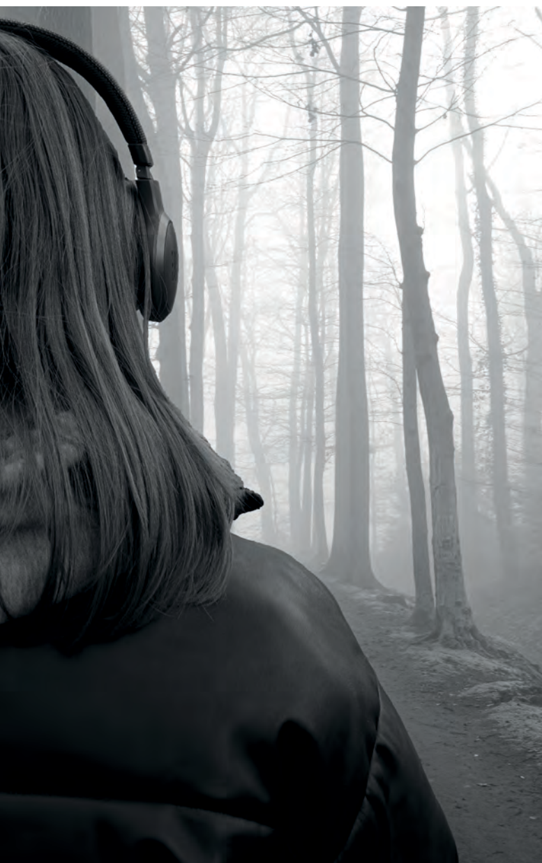
Titel: Walking Alone

deed ze ook een beetje omdat zij ook merkte van ja, straks dan lukt het niet, en moet je van school af. En dat vond zij heel erg. Dus zij vond ook eigenlijk heel erg dat ik naar het mbo ging. [...] ze gaf heel erg idee alsof je dan dom bent, of zo. [...] ze vertelde het ook niet aan haar man, of nou ja, mijn stiefvader. Dat vertelde ze ook echt niet tegen hem.” (mbo4, BOL)