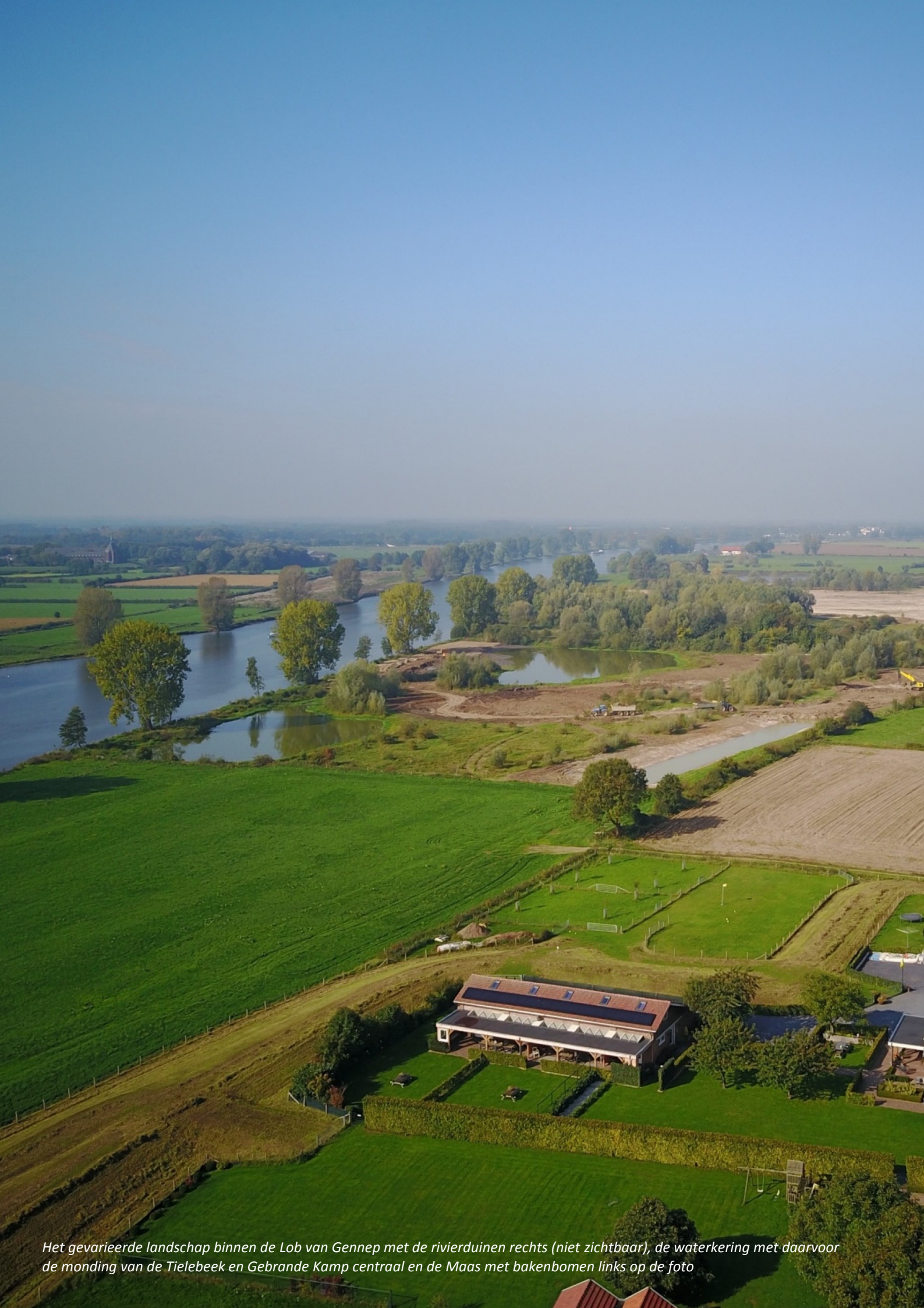
Het gevarieerde landschap binnen de Lob van Gennep met de rivierduinen rechts (niet zichtbaar), de waterkering met daarvoor de monding van de Tielebeek en Gebrande Kamp centraal en de Maas met bakenbomen links op de foto