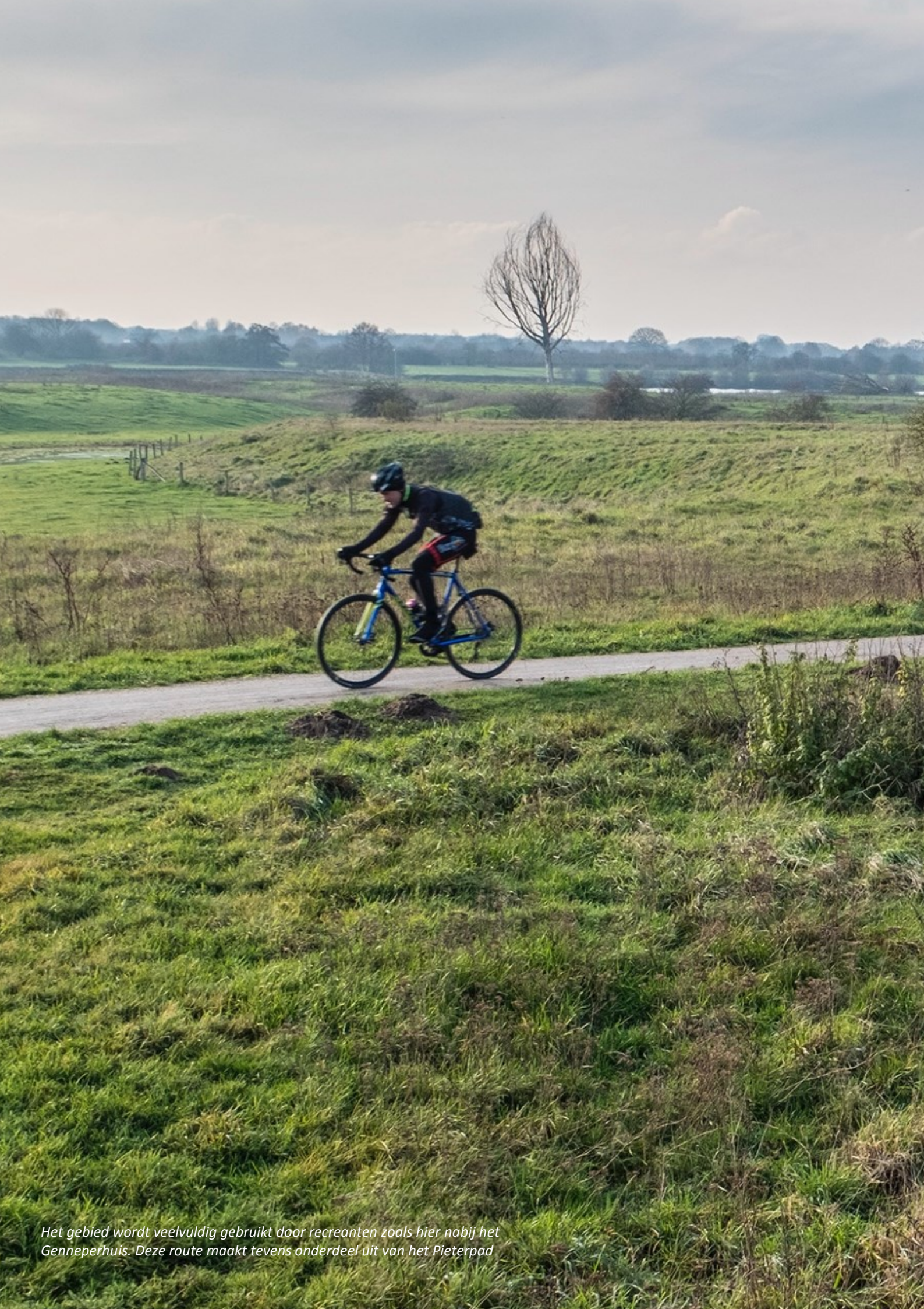
Het gebied wordt veelvuldig gebruikt door recreanten zoals hier nabij het Genneperhuis. Deze route maakt tevens onderdeel uit van het Pieterpad