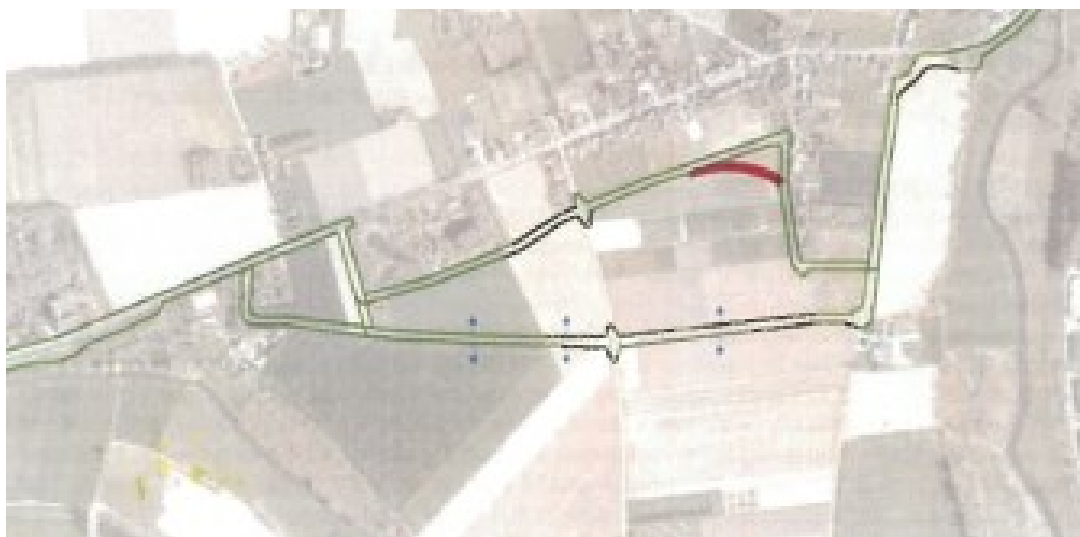
Afbeelding 4: concept-schetsvoorstel afbuiging variant B.

Met deze afbuiging zal er recht gedaan aan de wensen van de omwonenden en aan de belangen van participant.