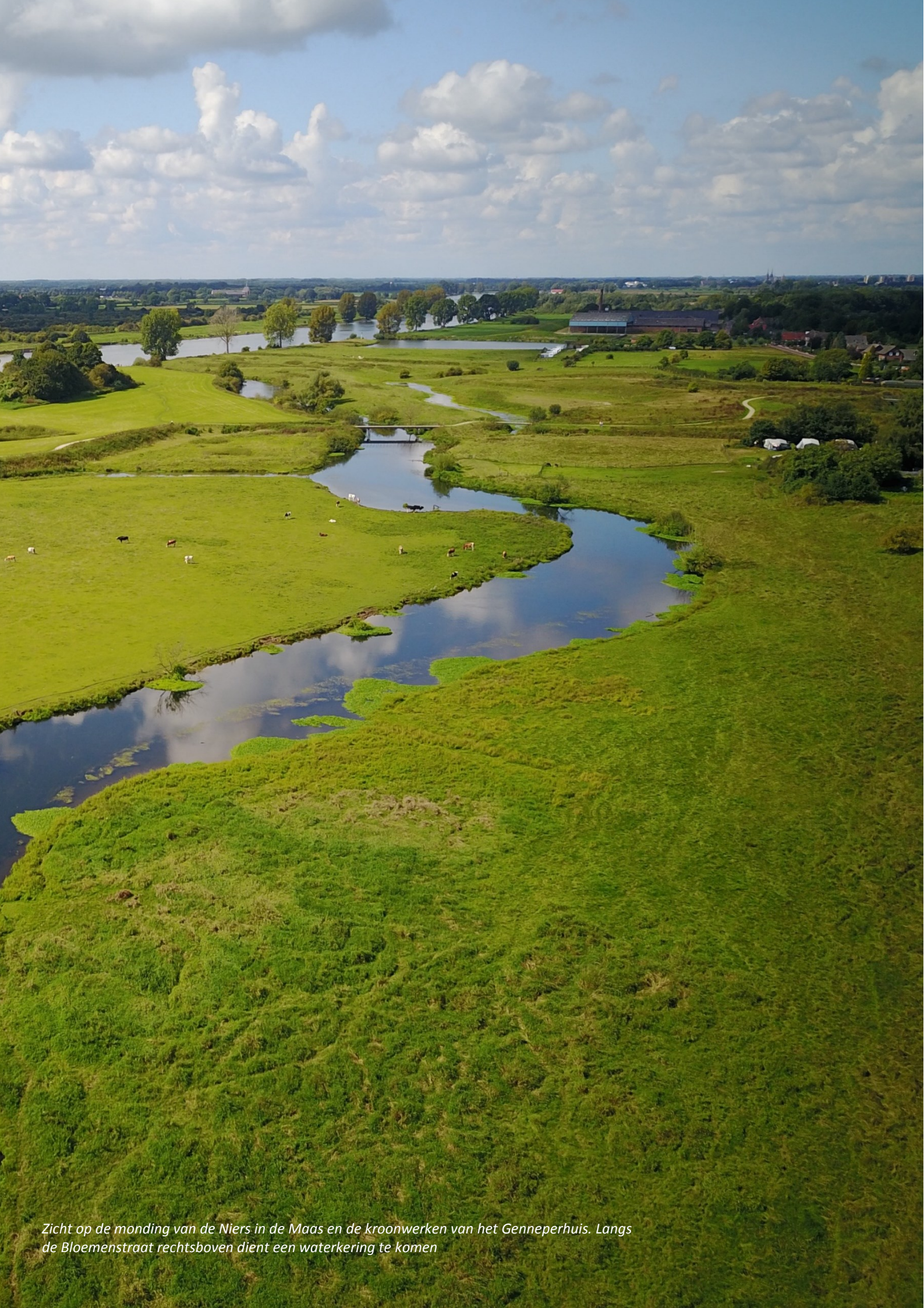
Zicht op de monding van de Niers in de Maas en de kroonwerken van het Genneperhuis. Langs de Bloemenstraat rechtsboven dient een waterkering te komen