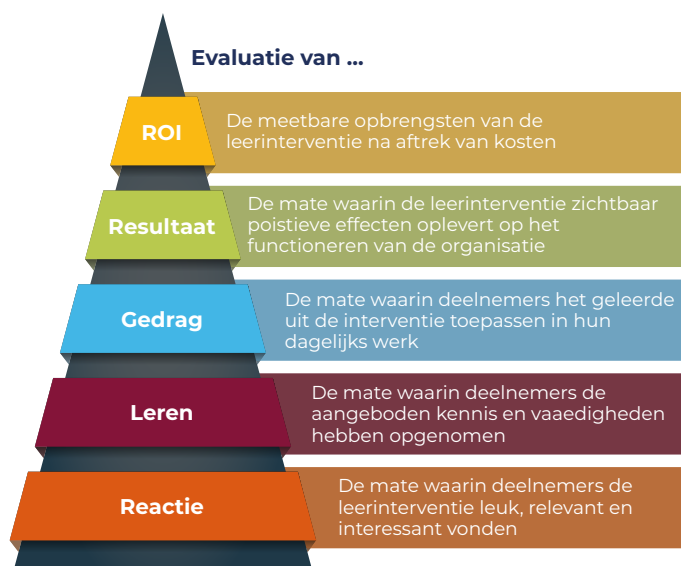
Figuur 2. Evaluatiemodel van Kirkpatrick 29

Om meer grip te krijgen op de doeltreffendheid van de KiPZ-regeling, moet de doelstelling van KiPZ duidelijker geformuleerd worden: wat valt er wel en niet onder strategisch opleiden?