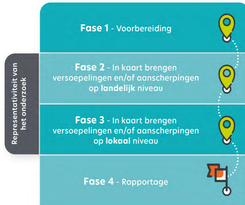
Figuur 2. Fasering van de onderzoeksmethodiek

Op basis van de uitkomsten van fase 1 zijn vragen opgesteld voor de interviews. In de 20 interviews is met landelijke uitvoeringsorganisaties, brancheorganisaties en beroepsverenigingen besproken welke versoepelingen en aanscherpingen van de regeldruk zij hebben ervaren, gezien en toegepast tijdens de coronacrisis, bijvoorbeeld als gevolg van maatregelen die tijdens de coronacrisis getroffen zijn. In de interviews is met name gesproken met (senior) beleidsmedewerkers en directieleden van de landelijke partijen. De lijst met betrokken organisaties is te vinden in bijlage B en een overzicht van deelnemers aan de groepssessies in bijlage C. Van de opgehaalde punten uit zowel het literatuuronderzoek als de interviews is het analysekader ingevuld met alle versoepelingen en aanscherpingen die naar voren zijn gekomen uit de gesprekken en de documentenanalyse, ingedeeld naar de verschillende sectoren. Dit vormt de input voor fase 3.