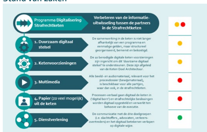
Stand van zaken van de vijf digitaliseringsdoelen

Voor het digitaliseringstraject heeft het programma 5 doelstellingen vastgesteld waarvan de status in bovenstaande tabel wordt weergegeven. De doelstelling op het gebied van dienstverlening aan de burger is tijdig bereikt. De andere doelstellingen zullen, zoals uit het voorgaande blijkt, de komende jaren worden gerealiseerd. De 'overall' status van het digitaliseringstraject wordt gekwalificeerd als "oranje/rood".