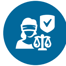
Waarden en rechten, rechtsstaat en veiligheid