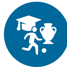
Onderwijs, cultuur, jeugdzaken en sport