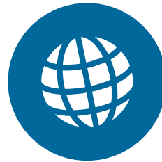
Rol van de EU in de wereld