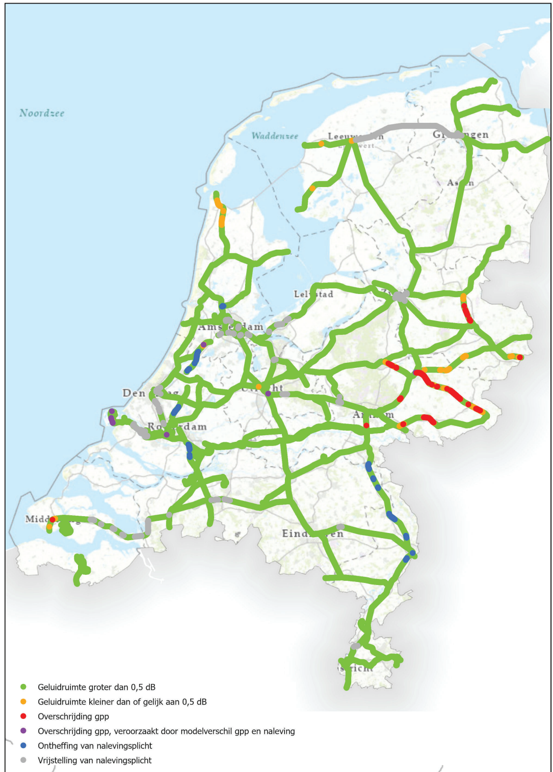
Figuur 2: Landelijk beeld van de gpp-naleving in 2020