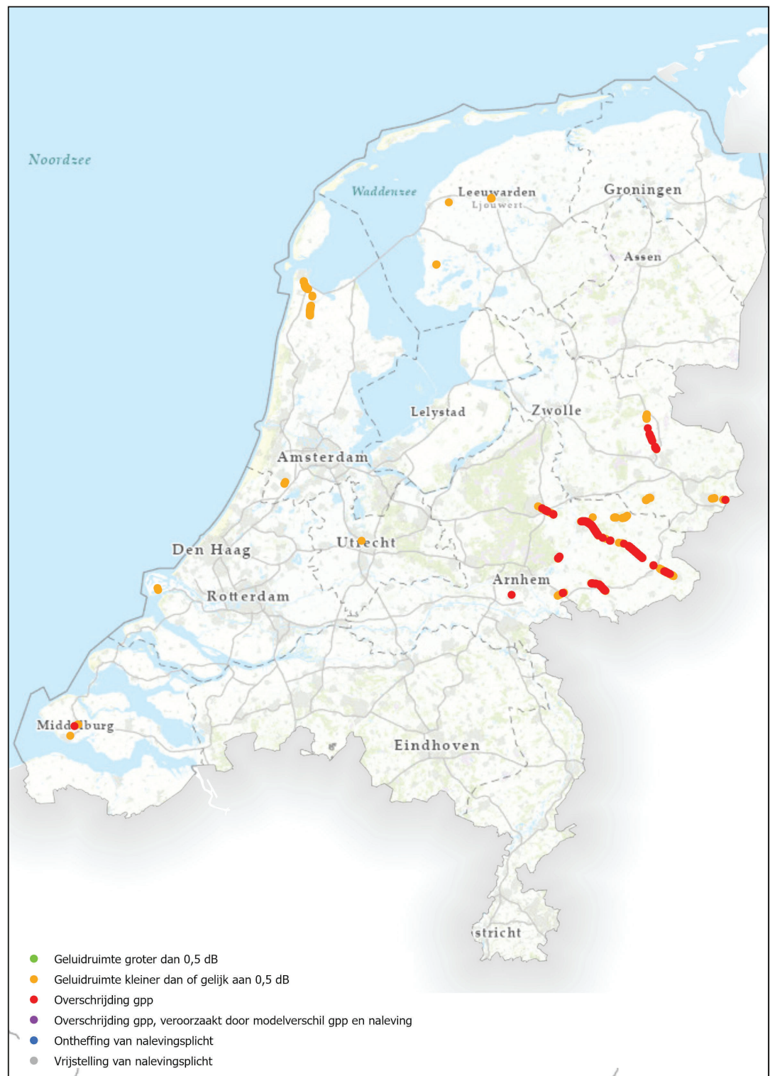
Figuur 1: Landelijk beeld van gpp-overschrijdingen en baanvakken met een krappe geluidruimte

In de volgende paragrafen worden de twee categorieën gpp-overschrijdingen nader uitgewerkt.