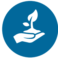
Klimaatverandering en milieu