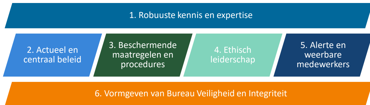
Figuur 2: De zes thema's van de Verbeteragenda en rechts de bijbehorende doelen

De aanbevelingen uit het rapport hebben een nieuw momentum gecreëerd waarvan we gebruik willen maken in het verder doorvoeren van verbeteringen. Uit gesprekken binnen de organisatie blijkt tegelijkertijd dat collega's hechten aan een integrale aanpak waarbij lopende werkzaamheden niet vergeten worden. Om dit te borgen zijn zes thema's opgesteld waarlangs de activiteiten binnen de Verbeteragenda zijn uitgewerkt. De thema's en doelstellingen per thema zijn hieronder weergegeven (Figuur 2). Om te duiden hoe de aanbevelingen uit het rapport inzake corruptierisico's een plek hebben gekregen staat op de volgende pagina weergegeven hoe de zes geïdentificeerde thema's zich verhouden tot de aanbevelingen van het rapport (Tabel 1). In het volgende hoofdstuk worden de thema's verder uitgewerkt.