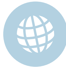
Rol van de EU in de wereld