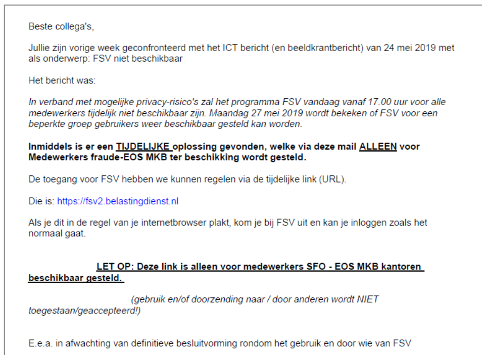
Figuur 4: e-mailbericht gebruikers mei 2019 166

De interne link tot FSV was https://fsv.belastingdienst.nl . 164 Op 29 mei 2019 is het volgende e-mailbericht verzonden aan medewerkers van directie MKB die weer toegang kregen tot FSV: 165