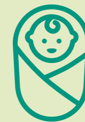
ROND DE GEBORTE