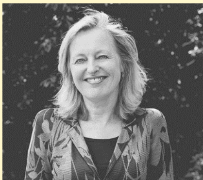
Prof. dr. Jet Bussemaker Hoogleraar Wetenschap, beleid en maatschappelijke impact LUMC