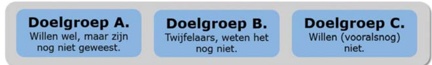
Figuur 1. Er zijn drie groepen te onderscheiden van mensen die nog niet gevaccineerd zijn.

De interventies die de GGD'en de afgelopen maanden hebben ingezet, zijn vooral gericht op doelgroep A: mensen die zich willen laten vaccineren, maar dat om wat voor reden dan ook nog niet hebben gedaan. Zij ervaren vaak fysieke barrières, die weggenomen kunnen worden door interventies als prikkenzonderafpraak.nl, de prikbus, de vrije inloop, pop-up locaties, etc. Daarmee zorgen de GGD'en ervoor dat het daadwerkelijk laten zetten van de prik zo makkelijk mogelijk wordt gemaakt. Maar ook wordt op doelgroep B ingezet met duidelijke informatie op meerdere manieren en met meerdere kanalen.