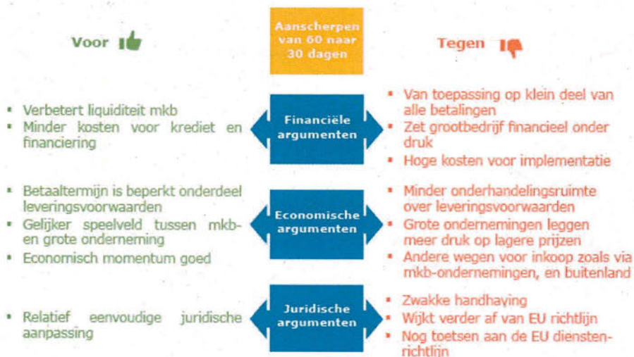
Figuur 3. Samenvatting argumenten voor en tegen de voorgestelde aanscherping naar 30 dagen.

In de onderstaande figuur zijn de diverse argumenten samengevat.