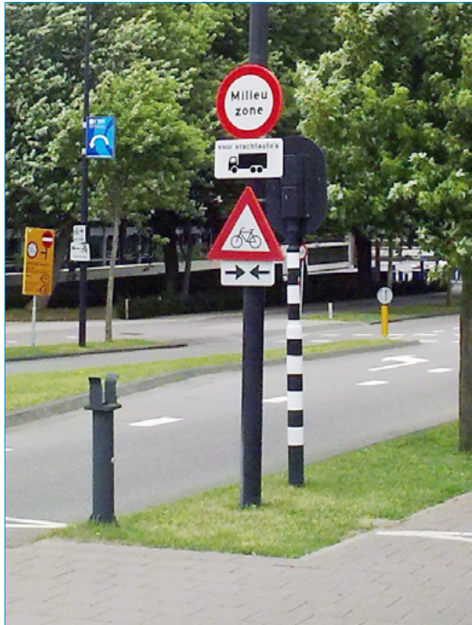
Milieuzone Amsterdam

Gemeenten: aansluiten bij huidige technische en juridische systematiek, één regievoerend en ontzorgend systeem en wens om op termijn meer parameters uit te wisselen.