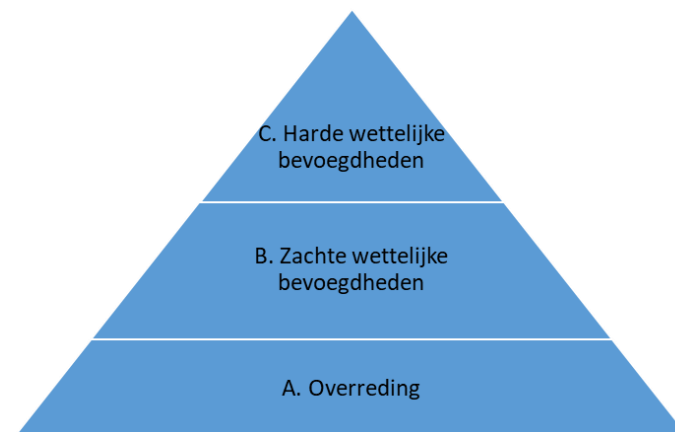
Figuur 3 Interventiepiramide - ontleend aan Toezichtarrangement DNB en AFM

Onder de piramide zijn de bevoegdheden van de minister van SZW ten aanzien van de zbo's op hoofdlijnen – niet uitputtend – weergegeven. In het kader van het toezicht kunnen instrumenten onder A. in relatie tot het bespreken van kwesties ook worden gebruikt ten aanzien van de opdrachtgever en eigenaar als partijen in de sturingsrelatie.