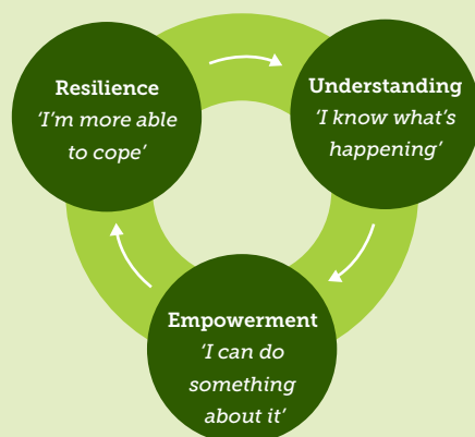
Figuur 2: Virtuous circle of parental empowerment (ontleend aan Shuker, 2017)

Uit het evaluatieonderzoek van Shucker en Ackerly (2017) naar aanleiding van het inzetten van een PLO in de gezinnen, blijkt de meerwaarde van de PLO voornamelijk te zitten op drie dimensies: (i) 'Understanding', (ii) 'Empowerment' en (iii) 'Resilience'. Daarbij lijkt de een de ander te versterken, wat een positieve spiraal van gebeurtenissen in gang zet. Deze drie dimensies worden hierna verder uiteengezet op basis van het werk van eerdergenoemde auteurs (2017). Zie figuur 2 voor een visuele weergave van het model.