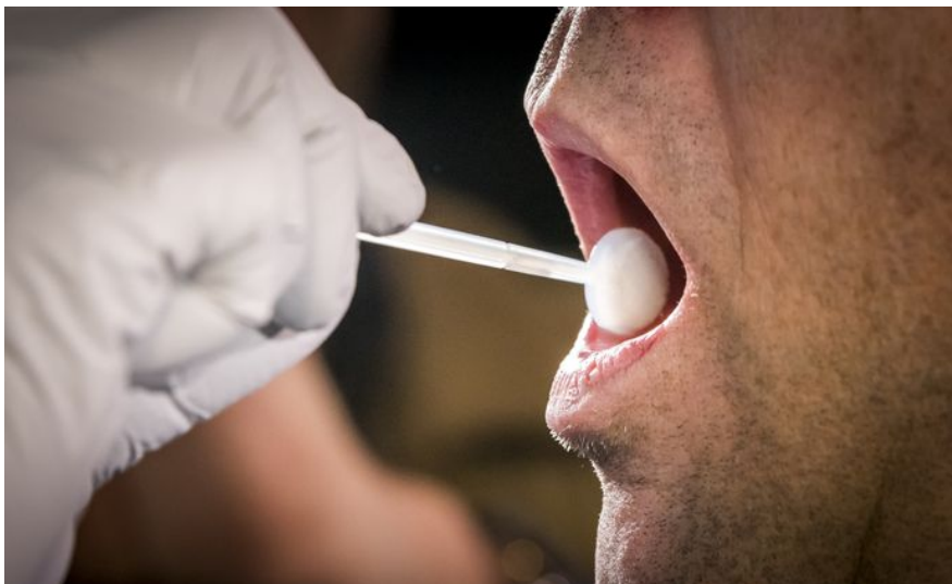
2 Afnemen van celmateriaal

De haalbaarheidsstudie kijkt naar de werkbaarheid van het werkproces. Daarbij worden de essentiële stappen van dat werkproces beschouwd, tot het detailniveau van bedrijfsproces. Dat is minder gedetailleerd dan het niveau van werkinstructie – maar voldoende voor het kunnen beantwoorden van de in hoofdstuk 2 weergegeven vragen, inclusief het maken van een grove inschatting van de hoeveelheid werk en de kosten.