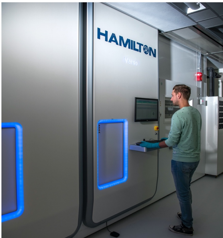
4 Opslagrobot Verso van NFI

Totaal: circa €617.000/jaar. Dit betreft een grove schatting. Hierbij is uitgegaan van het volume van scenario 4.1.a; voor het lagere volume van scenario 1.a zou het enkele procenten goedkoper kunnen zijn. De orde van grootte is hetzelfde.