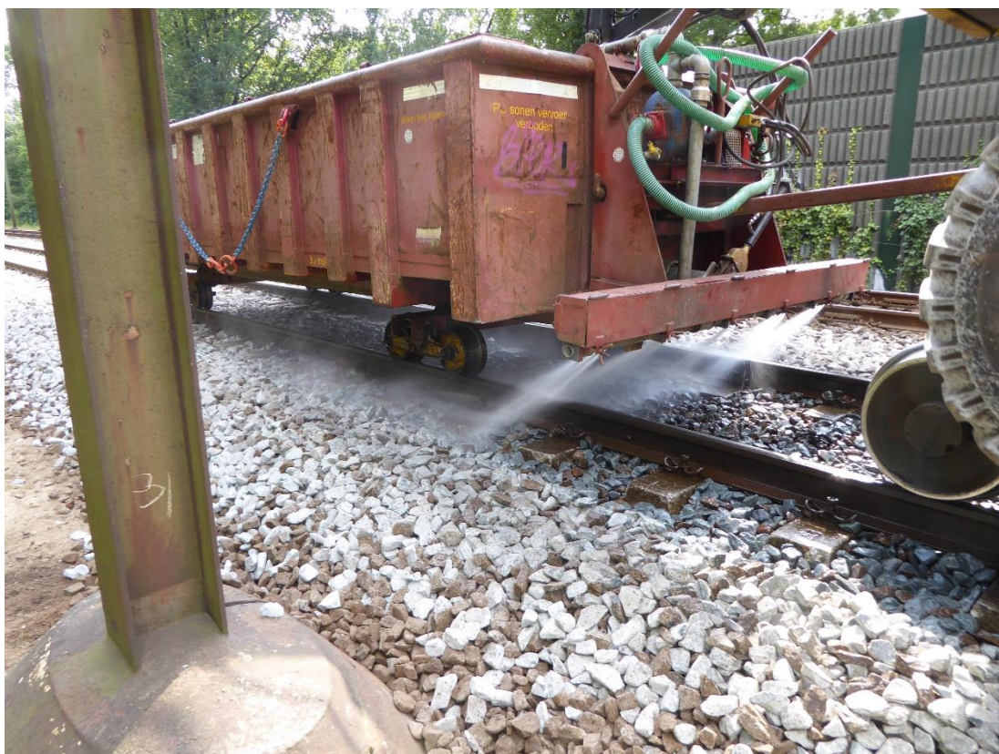
Afbeelding 2: nat maken geloste ballast met lorriecontainer