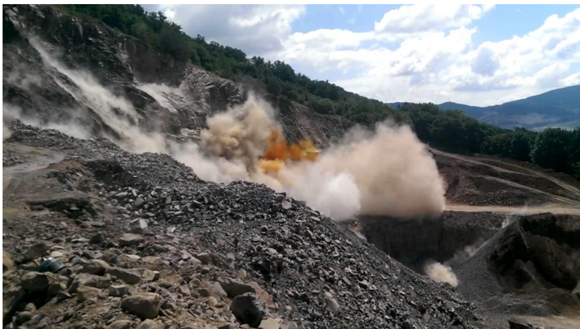
Afbeelding 1: Bremanger Quarry Noorwegen