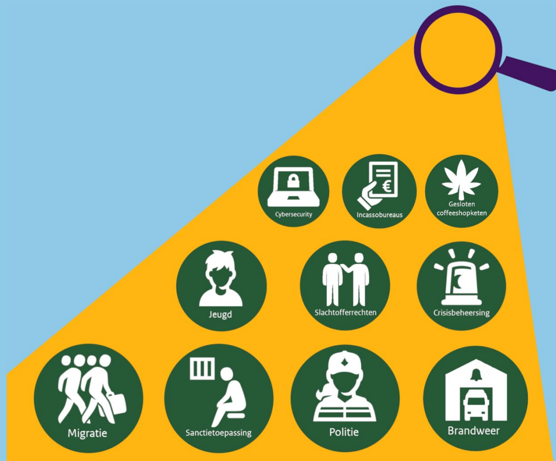
Afbeelding: toezichtgebieden IJenV