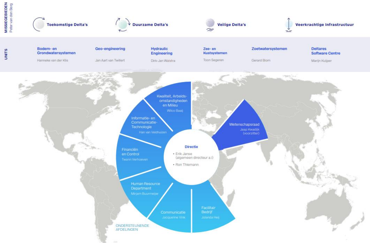
Figuur 1. Organogram Deltares februari 2020.