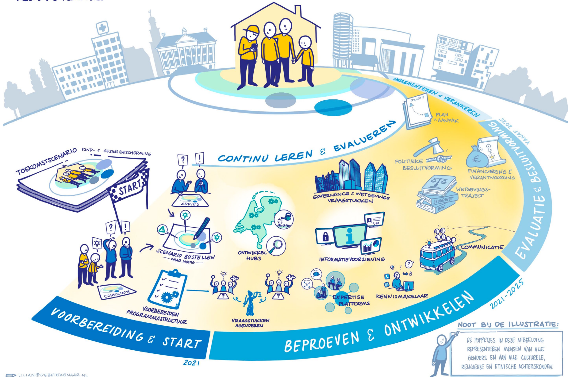
Afbeelding 2 - De routekaart