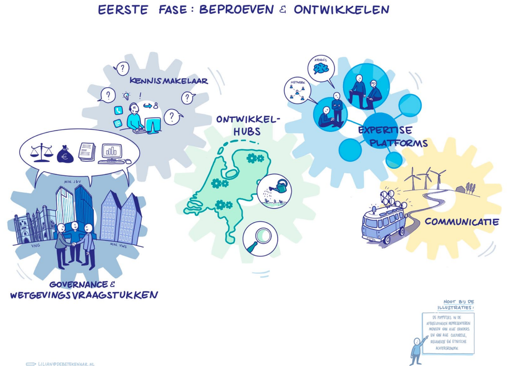
Afbeelding 3 - Vervolgaanpak

Er wordt snel gestart met de regionale proeftuinen, ook wel ontwikkelhubs genoemd. Doel van de regionale proeftuinen is werken conform het toekomstscenario van kind- en gezinsbescherming. In de ontwikkelhubs wordt beproefd hoe de variëteit aan (veiligheids)vraagstukken die zich binnen een gezin kunnen voordoen, opgepakt en behandeld worden in het Lokaal Team, in verbinding met een Regionaal Veiligheidsteam. Ook wordt uitgetoetst hoe inhoudelijke specialismen en het netwerk hierbij adequaat betrokken kunnen worden. Er wordt ervaring opgedaan met wat wel en niet werkt in de praktijk, waarom dat zo is en waarop bijgestuurd en aangepast moet worden. Zo wordt kennis ontwikkeld voor de volgende fases.