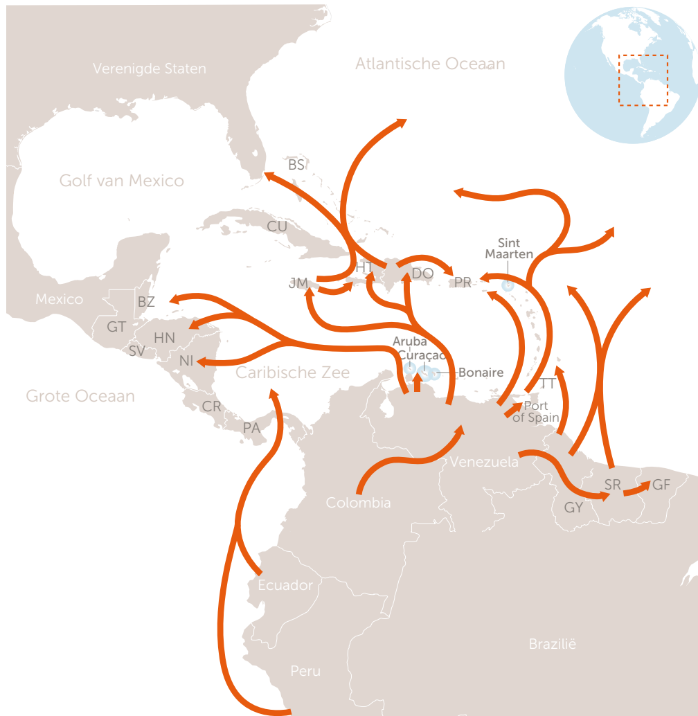
Figuur 2 - Drugsroutes Caribisch gebied