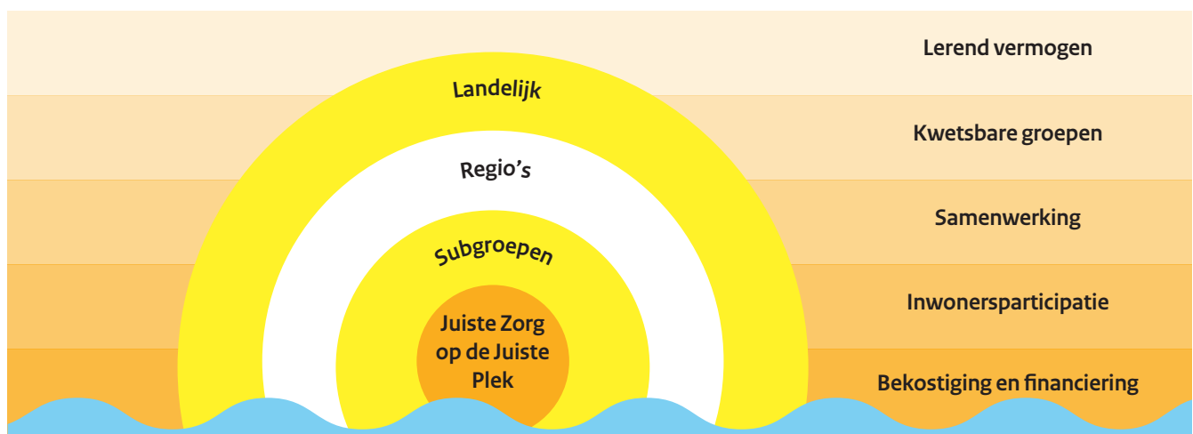
Figuur 2. Inhoudelijke focus lerende evaluatie JZOJP

De deelnemers aan de actietafels willen graag aan de slag met de door hen benoemde ontwikkelvragen . Dit zal in 2021 gebeuren tijdens de actietafels alsook tijdens verdiepende case-studies met de deelnemers aan de actietafels. Zo wordt met de actietafel van de leerregio's gestart met een bijeenkomst in het voorjaar gericht op een domeinoverstijgende verbetercyclus, een tool om als regio de versnellingskansen in de samenwerking te achterhalen, en een businesscase vanuit sociaal en medisch domein. Verder zoomen we in 2021 op drie specifieke subgroepen in: ouderen, mensen met mentale diversiteit en veelgebruikers. Deze activiteiten worden afgestemd en verbonden met andere programma's en initiatieven, zoals de GROZzerdammen (Health Holland, 2020) en het kennisplatform JZOJP. Tevens zullen we met de actietafels en de landelijke tafel aan de slag gaan met de centrale hoofdvraag: 'wat is nodig om de beweging JZOJP verder te brengen?'. Wat is nodig om de beweging JZOJP verder te brengen?