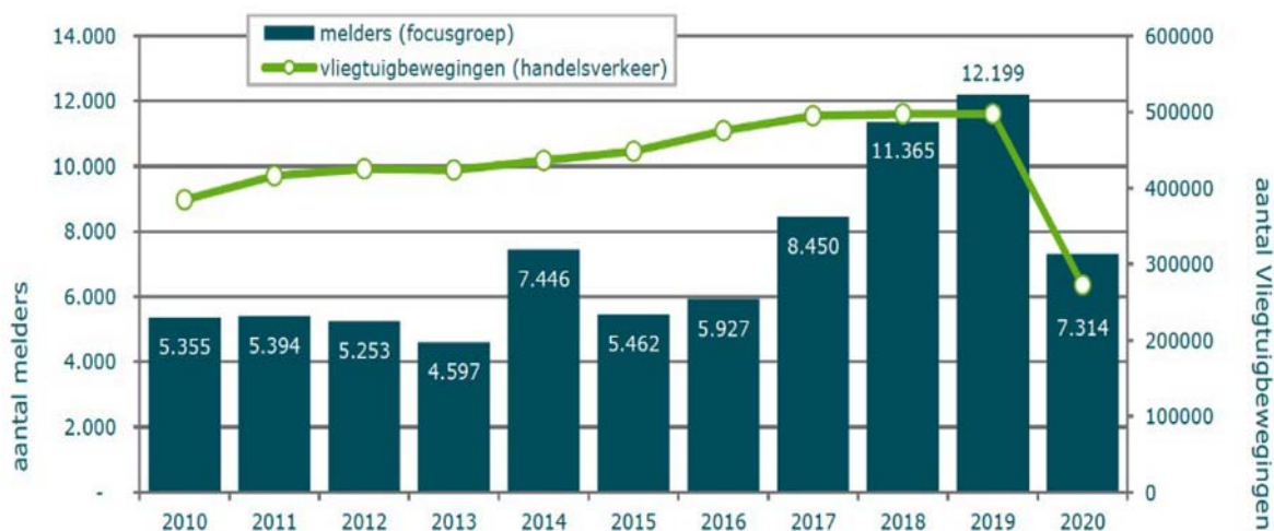
Figuur 1 Aantal melders per jaar (focusgroep)