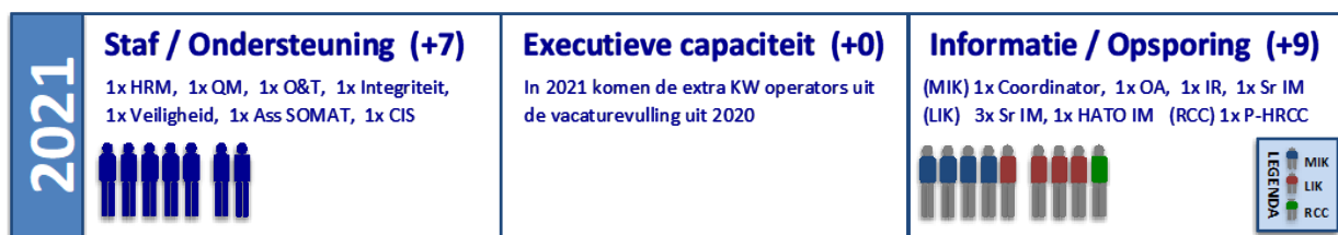
Figuur 1 Beoogde toename personeel in 2021

Bovenstaande staat uitgebeeld in figuur 1.