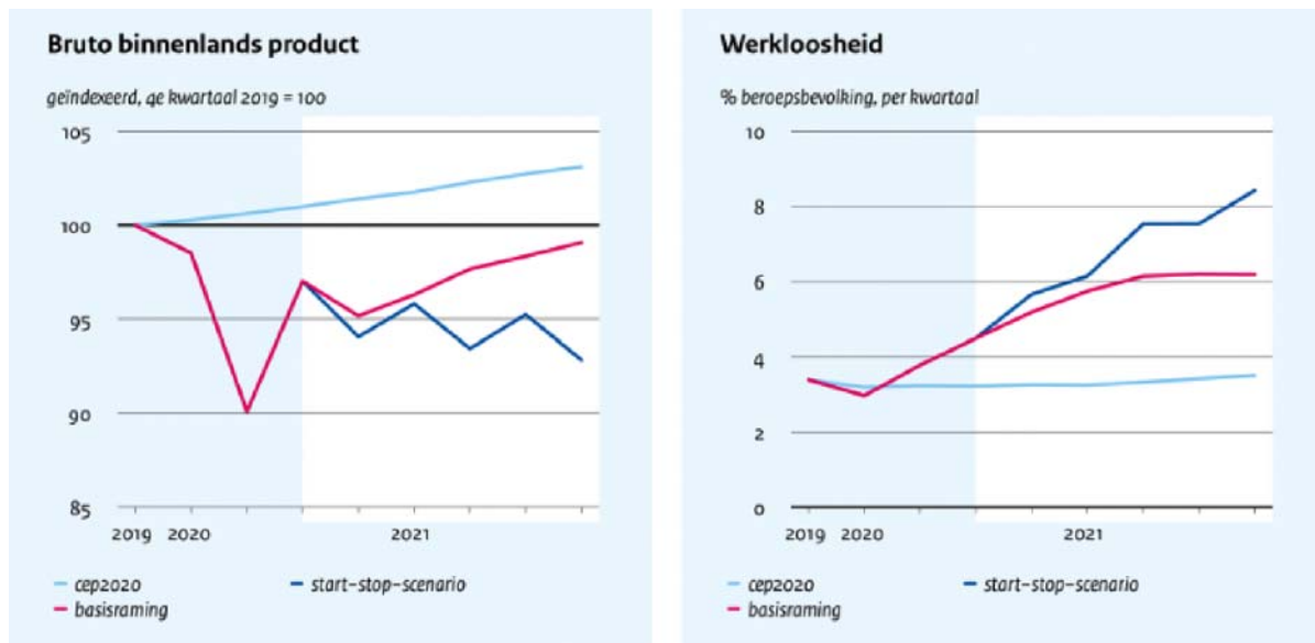
Figuur 1a en 1b: Bruto binnenlands product en werkloosheid 2020 en 2021

In de basisraming verwacht het CPB een economische krimp in 2020 van 4,2 procent. Op bijna alle vlakken loopt de economische activiteit terug ten opzichte van 2019. Mensen geven minder uit en ook de investeringen en uitvoer krimpen. Om de klap op te vangen staan hier hogere overheidsuitgaven tegenover. Naar verwachting herstelt de economie in 2021 slechts deels. Het CPB verwacht in de basisraming een economische groei in 2021 van 2,8 procent. Door de economische omslag loopt de werkloosheid sterk op tot ongeveer 6,1 procent van de beroepsbevolking in 2021. In het start-stop-scenario zijn de economische gevolgen ingrijpender (zie figuur 1a en 1b). Het CPB verwacht dat de economie na een krimp van 4,5 procent in 2020 verder krimpt in 2021 met 0,6 procent. In dit scenario is de omvang van de economie eind 2021 10 procent kleiner dan geraamd voor de uitbraak van de pandemie. De werkloosheid komt in dat geval eind 2021 uit op 7,5 procent van de beroepsbevolking. Gelukkig was de uitgangspositie van Nederland goed, met een lage structurele werkloosheid en gezonde overheidsfinanciën. Ook blijft het kabinet de economie ondersteunen met het steunpakket dat loopt tot de zomer van 2021. Dat neemt niet weg dat de crisis forse economische gevolgen heeft voor veel mensen en dat de situatie de komende tijd erg onzeker blijft.