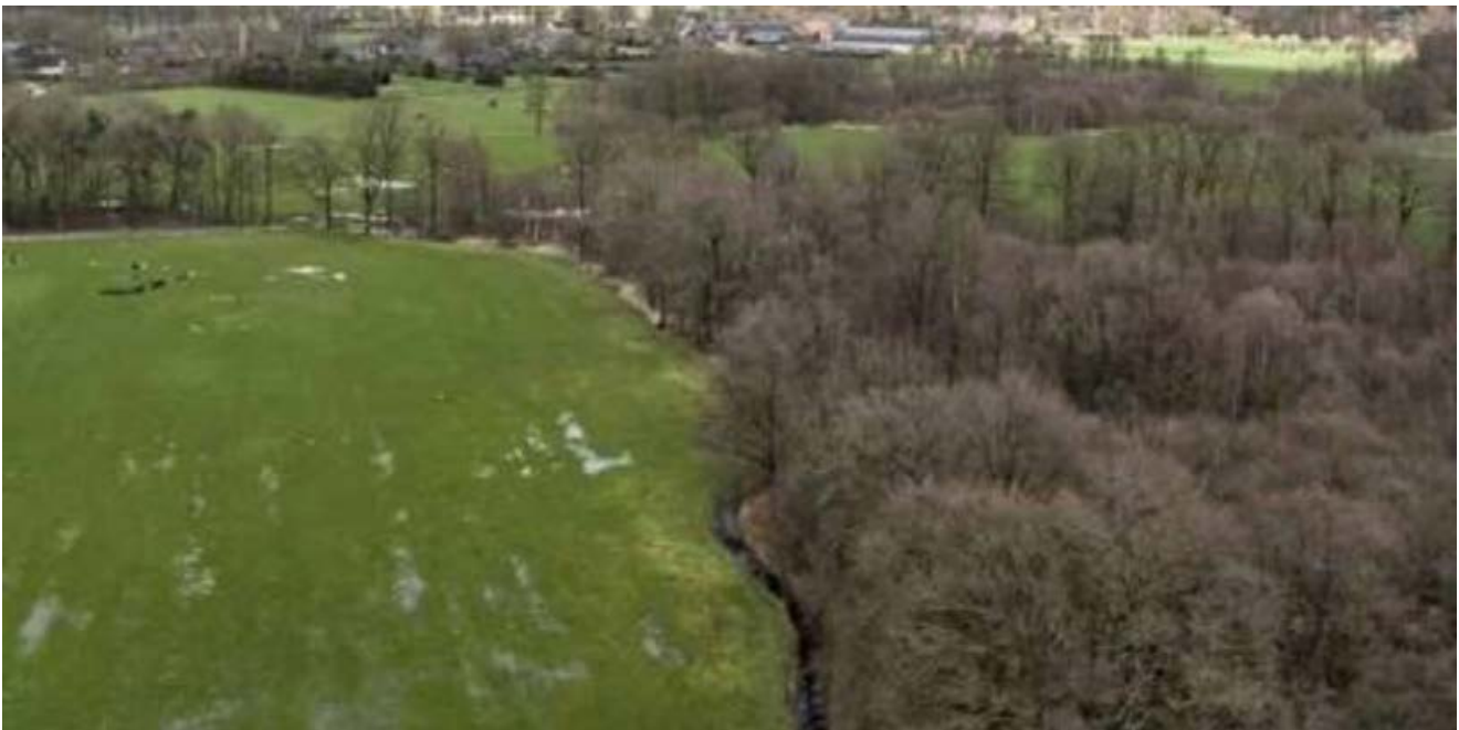
Natura 2000-gebied Leenderbos, Grootte Heide & De Plateaux.

Er moet in de komende tien jaar veel in en rondom de stikstofgevoelige Natura 2000-gebieden gebeuren. We kiezen voor een gebiedsgerichte aanpak waarin we naast natuurherstel zoveel mogelijk van deze andere opgaven meenemen. De afgelopen maanden zijn vergaande voorbereidingen getroffen, zodat we een snelle start kunnen maken. We zijn ervan overtuigd dat we het herstel van de natuur alleen kunnen bereiken als we de opgaven aan elkaar verbinden en daarbij nauw samenwerken met onze partners in het gebied. Zodat onze prachtige natuurgebieden in 2030 weer bruisen van het leven en de rijke biodiversiteit weer terugkeert.