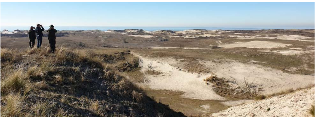
Herstelmaatregelen ter bevordering van de duindynamiek op de Kop van Schouwen.

De eerste drie jaar gebruiken we daarnaast ook om te monitoren en te bepalen welke maatregelen effectief zijn om vanaf 2023 op te nemen in onze Natura 2000-beheerplannen.