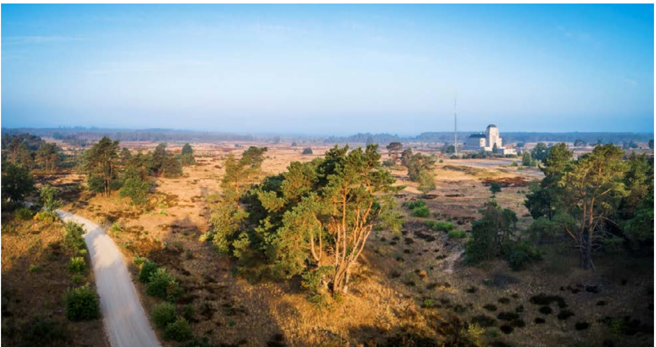
Radio Kootwijk: de grootste actieve zandverstuivingen van West-Europa.

Het Gelderse maatregelenpakket bestaat uit vijf onderdelen: 'natuurbeheer op orde', herstel van bestaande natuurgebieden, natuurinclusieve versterking in het agrarisch gebied rondom natuurgebieden, versterking natuurnetwerk in overgangsgebieden, en onderzoek, monitoring en evaluatie.