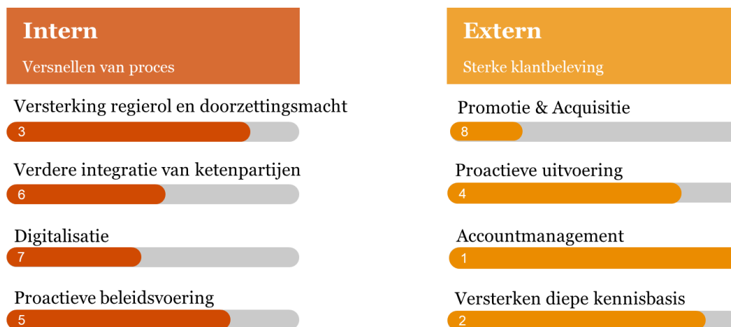
Figuur 1. Relatieve bijdrage aan kwaliteitsbeleving van de verschillende maatregelen volgens de registerpartijen

In de interviews met de marktpartijen is gevraagd een volgorde van maatregelen aan te brengen in de maatregelen. Met bovenaan de maatregel die het meest bijdraagt aan kwaliteitsbeleving. In Figuur 1 wordt de relatieve beoordeling van de maatregelen weergegeven. Accountmanagement en het versterken van de diepe kennisbasis zouden volgens de marktpartijen het meest bijdragen aan de kwaliteitsbeleving. Met als voorwaarde dat de accountmanager wel voldoende bevoegdheden en zeggenschap heeft om zaken sneller op te lossen of aan te kaarten dan de reders op dit moment zelf kunnen. Digitalisatie en Promotie & acquisitie staan het laagst op het lijstje. Hierover is gezegd dat beide maatregelen zeker wenselijk zijn maar dat het belangrijk is eerst de basis op orde te brengen en klantgericht te gaan werken voordat er nieuwe technieken worden gebruikt. Zo wordt er eerst gezorgd dat huidige klanten blijven voordat Promotie & acquisitie wordt ingezet om nieuwe klanten te werven.