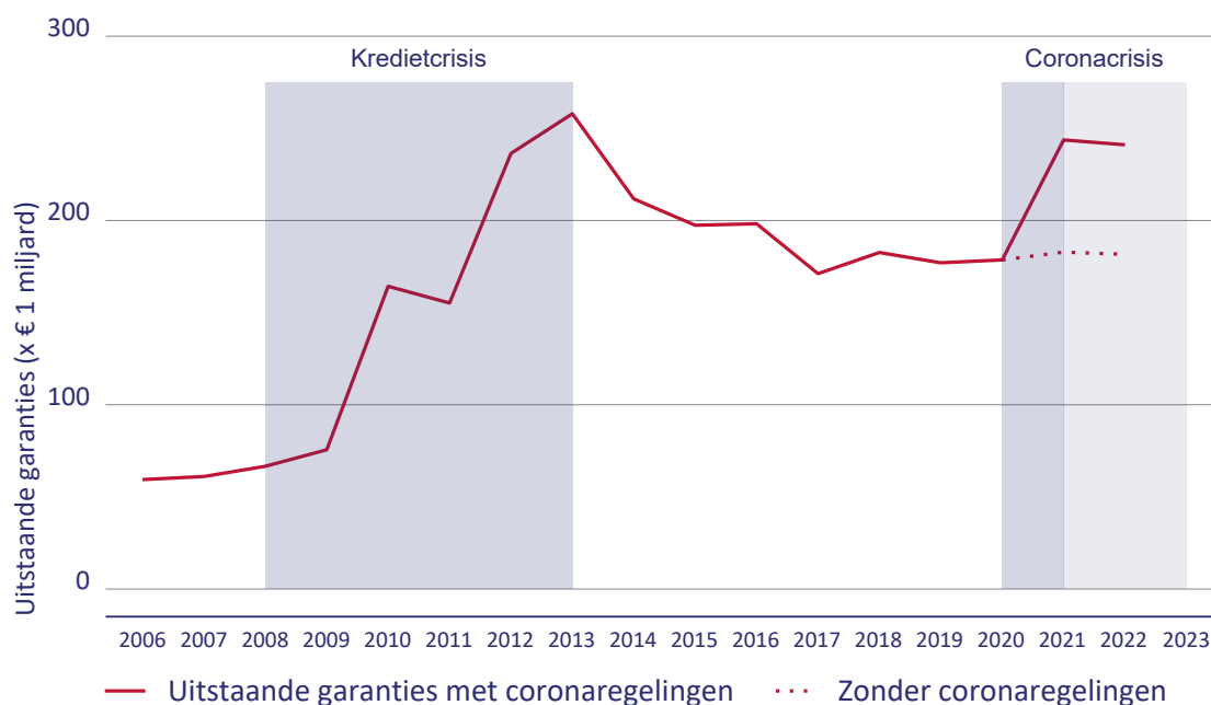
Figuur 4 Ontwikkeling garantieverplichtingen van het Rijk (2006-2022)

Het kabinet verwacht dat eind 2020 het bedrag aan uitstaande garanties weer sterk zal toenemen tot € 243,7 miljard. De stijging van € 65,1 miljard ten opzichte van 2019, is voor € 60,9 miljard het directe gevolg van de maatregelen die zijn getroffen om de gevolgen van de coronacrisis op te vangen. Zonder deze maatregelen zou het uitstaande risico zijn toegenomen met € 4,2 miljard tot € 182,8 miljard. Als gevolg van de verstrekte leningen nemen de risico's voor de overheidsfinanciën door de coronacrisis in totaal toe met € 62,7 miljard tot € 245,5 miljard. Met deze stijging bevinden de uitstaande risico's zich, door de risicoregelingen die zijn geïntroduceerd of verruimd om de financieel-economische gevolgen van de coronacrisis op te vangen, weer bijna op het hoogste niveau uit de periode van de kredietcrisis.