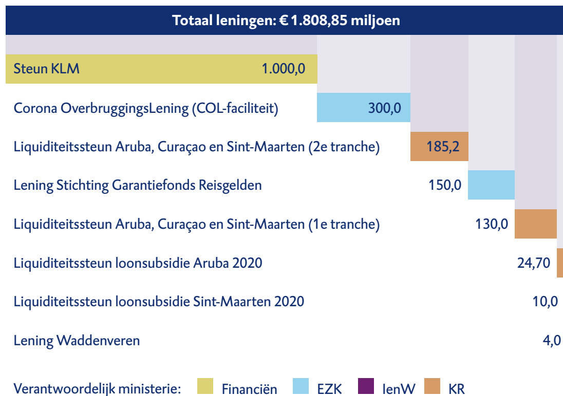
Figuur 3 Overzicht leningen coronacrisis