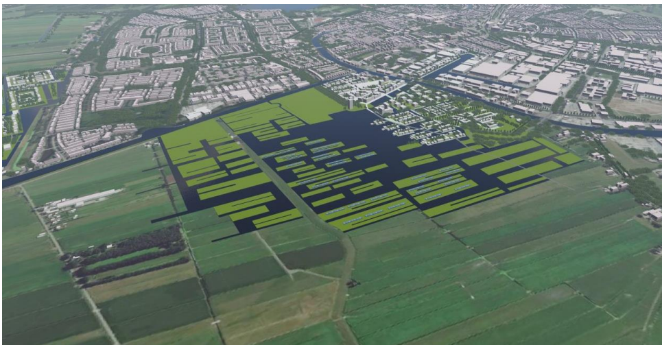
Gnephoek (gem. Alphen a/d Rijn), in concept (veto prov. Zuid Holland): max. 10.000 won.