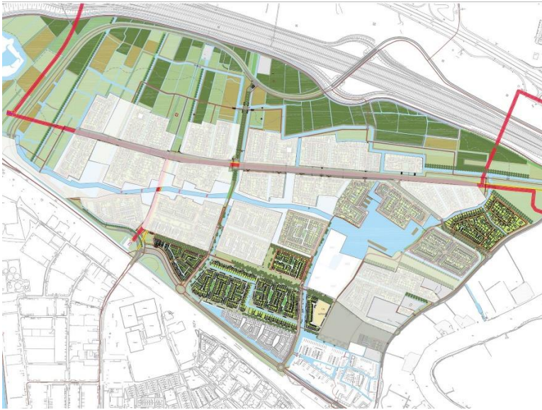
Weesperluis (gem. Weesp), in uitvoering: ca 2750 won.