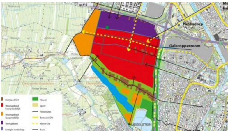
Rijnburg (gem. Utrecht), in concept (veto gem. Utrecht); ca. 25.000 won.