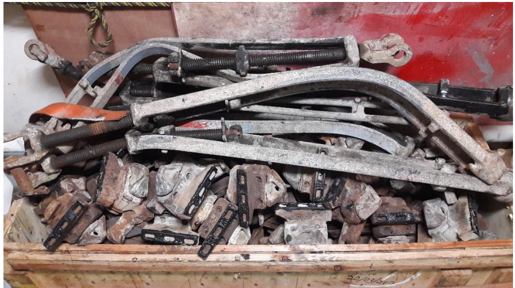
Foto: Beschadigde spanschroefverbindingen op een schip.

Zo zijn containerschepen door hun vorm gevoelig voor bijvoorbeeld parametrisch slingeren. De slingerhoek kan hierdoor bij sterke wind en hoge golven plotseling tot boven 38 graden toenemen. Bij zulke omstandigheden worden de krachten op de containers aan dek groot. Zelfs zo groot dat containers van het schip in zee kunnen vallen, ook al heeft het sjorbedrijf gesjord volgens het CSM.