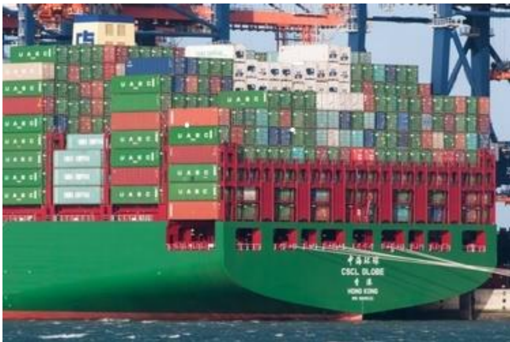
Foto: Alleen de containers direct boven de loopbruggen zijn gesjord met sjorstangen.

Op 12 schepen werkte de bemanning samen met een sjorbedrijf bij het sjorren van de lading. Op 41 schepen sjort een sjorbedrijf de lading. Omdat sjorren specialistisch en fysiek zwaar werk is, is het de vraag of de bemanning belast moet worden met dit werk. Vooral op de Europese containerdiensten krijgen bemanningen dan misschien niet voldoende rust. Dit komt doordat de schepen regelmatig havens bezoeken.