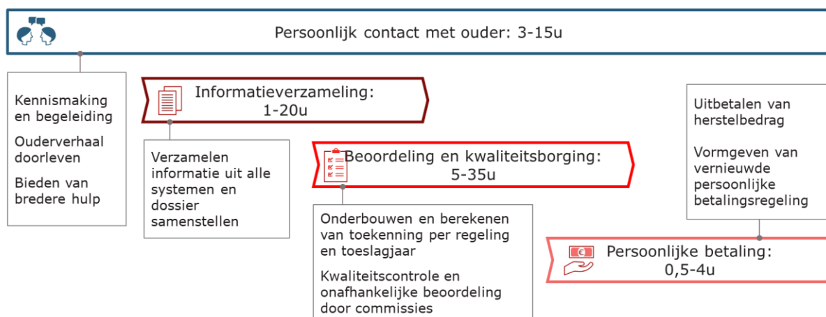
Figuur 3: Indicatie behandelijd per ouder voor herstelactiviteiten

Mijn belangrijkste conclusie uit figuur 3 is dat – na toepassing van de gekozen versnellingsoptie, optie 4 – verdere versnelling in het proces niet mogelijk is zonder afbreuk te doen aan de centrale uitgangspunten van de hersteloperatie. De voornaamste tijdsbesteding in het herstelproces zit namelijk in het individuele contact en maatwerk richting ouders inclusief het indien nodig helpen van ouders met aanvullende hulpvragen bij derden (~15-20%), in het verzamelen van informatie om de situatie van de ouders in kaart te brengen en het verhaal van de ouder te bevestigen (~30%), in het waarborgen van de consistentie en zorgvuldigheid van de beoordeling, zeker bij zaken waarin de ouder op basis van de regelingen geen (volledig) herstel kan krijgen (~40%), en in het vormgeven van een persoonlijke betaling rekening houdend met de situatie van de ouder (~10-15%). Het versnellen van deze activiteiten doet dus ofwel afbreuk aan de maatwerk hulp die we de ouder bieden ofwel aan de zorgvuldige, individuele beoordeling van de situatie van de ouder. Dit loslaten zou niet in lijn zijn met de afspraken die ik eerder met uw Kamer heb gemaakt en met de regelingen die ten behoeve van de hersteloperatie zijn ontworpen.