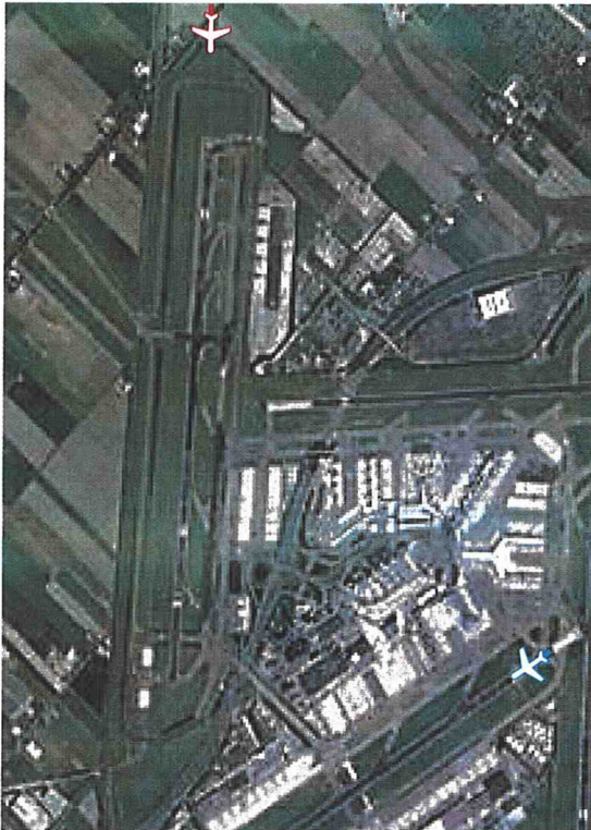
Figuur 2: De situatie om 19.55:11 uur, het tijdstip van de startklaring.