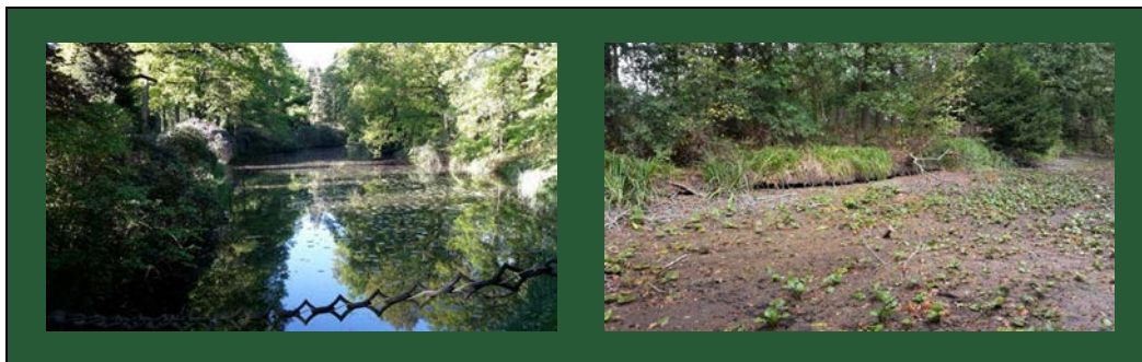
Afbeelding 3. Vijver en drooggevallen vijver op een landgoed 29

Uit onderzoek van Stichting Kastelen, Buitenplaatsen & Landgoederen (SKBL, september 2019) onder kasteel- en landgoedeigenaren geeft 78% van de respondenten aan blijvende schade te verwachten als gevolg van de droogte. Het SKBL-onderzoek 30 kreeg media aandacht van het NOS-journaal, de Telegraaf en EenVandaag 31 .