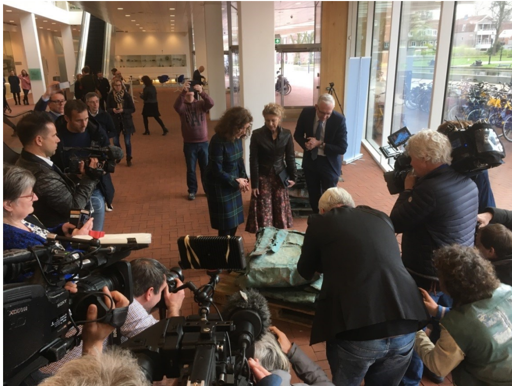
Veel belangstelling van de pers bij de presentatie aan de minister van bijzondere vondsten (in beeld de koperen platen uit het 16de eeuws scheepswrak) uit de Noordzee op 3 april 2019

In 2019 heeft de Inspectie verschillende meldingen van verdachte situaties op de Noordzee beoordeeld en onderzoek gedaan naar mogelijke illegale vondsten in de Noordzee. Daarbij bleek dat op de Nederlandse markt vervalste antieke kanonnen uit Azië worden aangeboden.