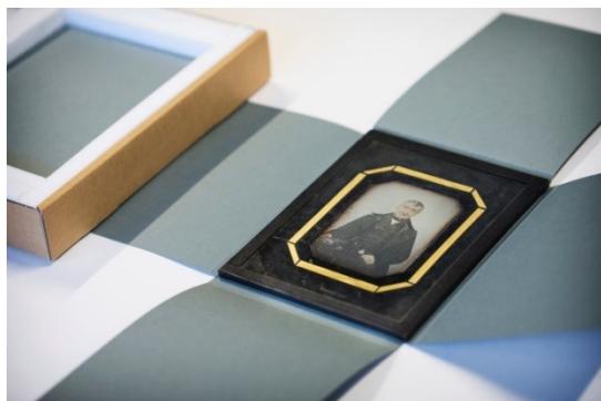
decoratieve afbeelding uit fotomuseum

De Inspectie heeft onderzoek gedaan naar de veiligheidszorg voor de rijkscollectie bij museale beheerders. Begin 2020 publiceert de Inspectie het onderzoeksrapport.