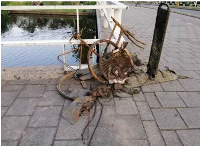
magneetvissen (regio Den Haag)

De schijnbaar onschuldige hobby van magneetvissen kan grote schade toebrengen aan cultureel erfgoed. Het is verboden en er staat een maximale gevangenisstraf van twee jaar op.