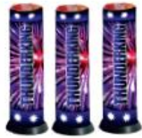
1. Single shot / Thunder Kling