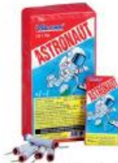
2. Rotje / kanonslag / astronaut