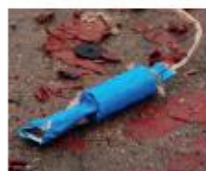
17. Vlinderbom / toffee