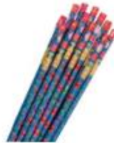
10. Romelense kaars