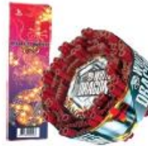
3. Ratelband / Chinese rol