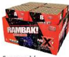
6. Compound / samengesteld vuurwerk