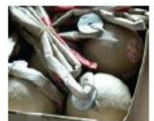
16. Mortierbom / display shell