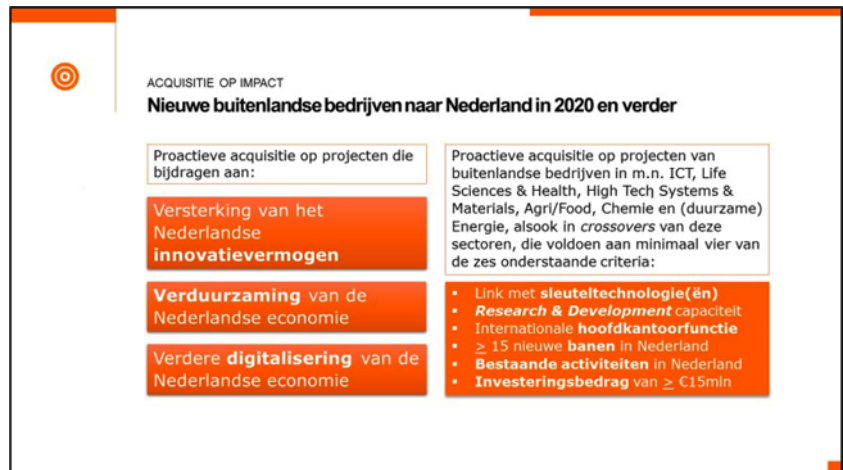
Figuur 4: Acquisitie op impact – High Priority Projects

De hoogte van de prestatieafspraken zal in de komende maanden, uiterlijk voor de zomer, definitief worden vastgesteld. Hiervoor is eerst een diepere analyse nodig. Hierbij zijn wel nu al twee dingen duidelijk: