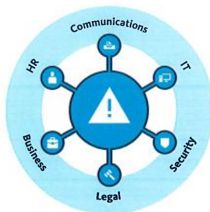
Figuur 1 – Crisis team