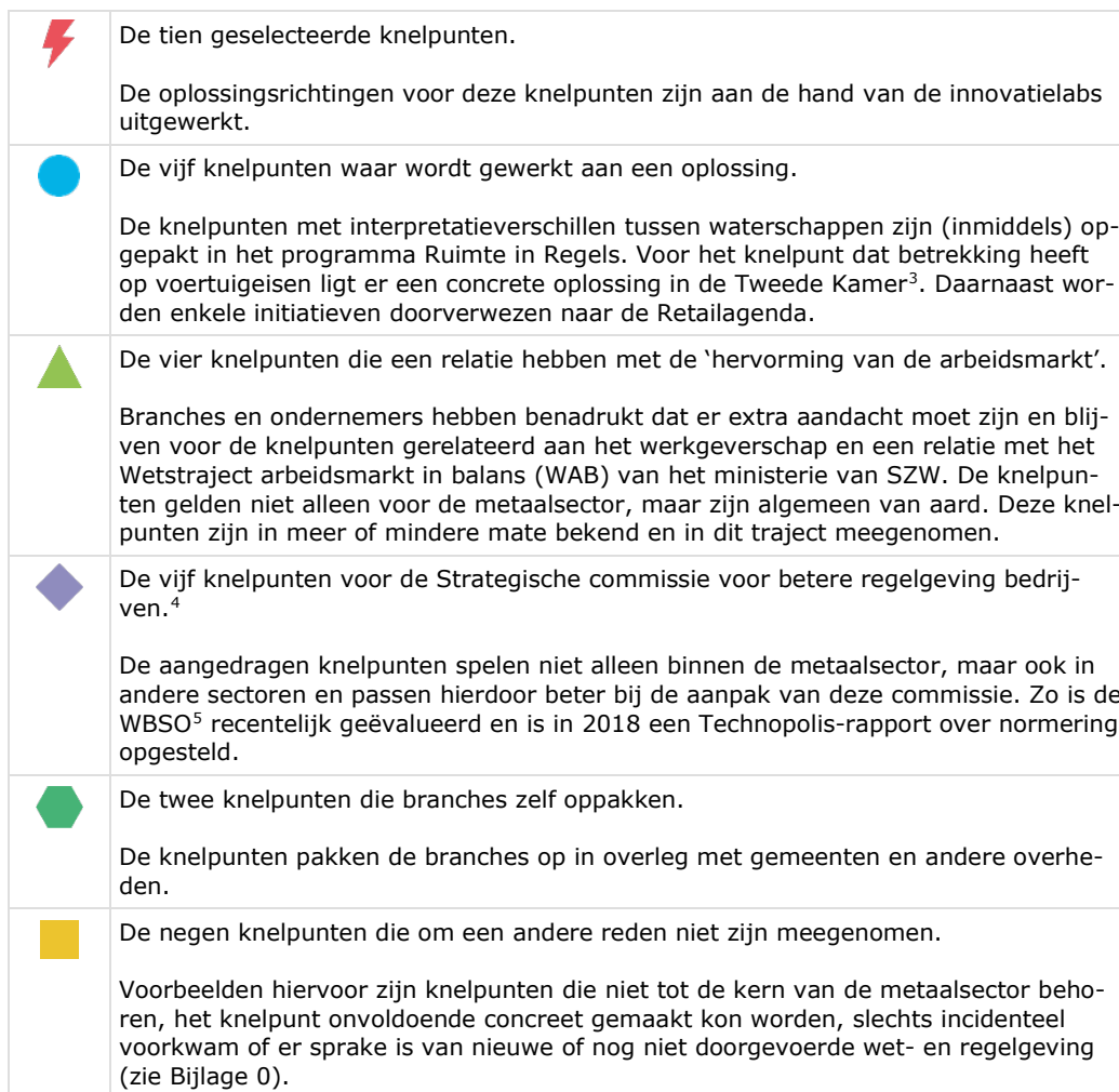
Tabel 1. Legenda bij de knelpunten