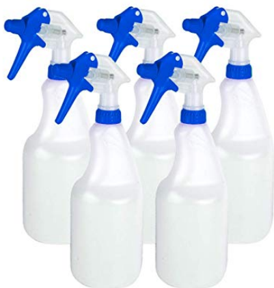
Figuur 2 Spuitflacons of triggersprays

De toegelaten gewasbeschermingsmiddelen voor particulieren zijn 'ready-to-use' oplossingen met 6% azijnzuur. De kant-en-klare producten zitten in een spuitflacon ('triggerspray'; zie Figuur 2). De dosering is 0,1 liter vloeistof per vierkante meter, dit komt overeen met 6 gram azijnzuur per m 2 . Bij pleksgewijze toepassing wordt aangenomen dat 10% van het oppervlak wordt behandeld en wordt daarom gerekend met een 10 maal lagere dosering (0,6 g/m 2 ). Oppervlakten mogen maximaal 4-6 keer per jaar worden behandeld waarbij er 14 dagen tijd moet zitten tussen de behandelingen.