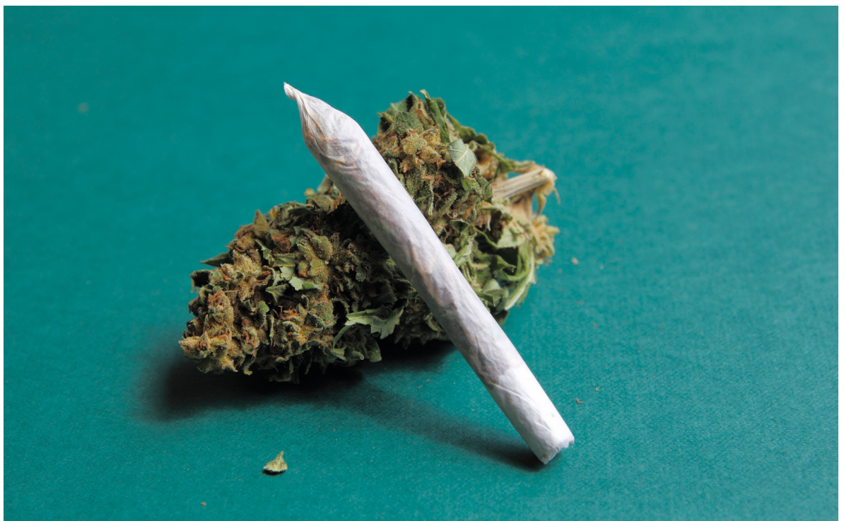
roken van cannabis in joint, puur of met tabak