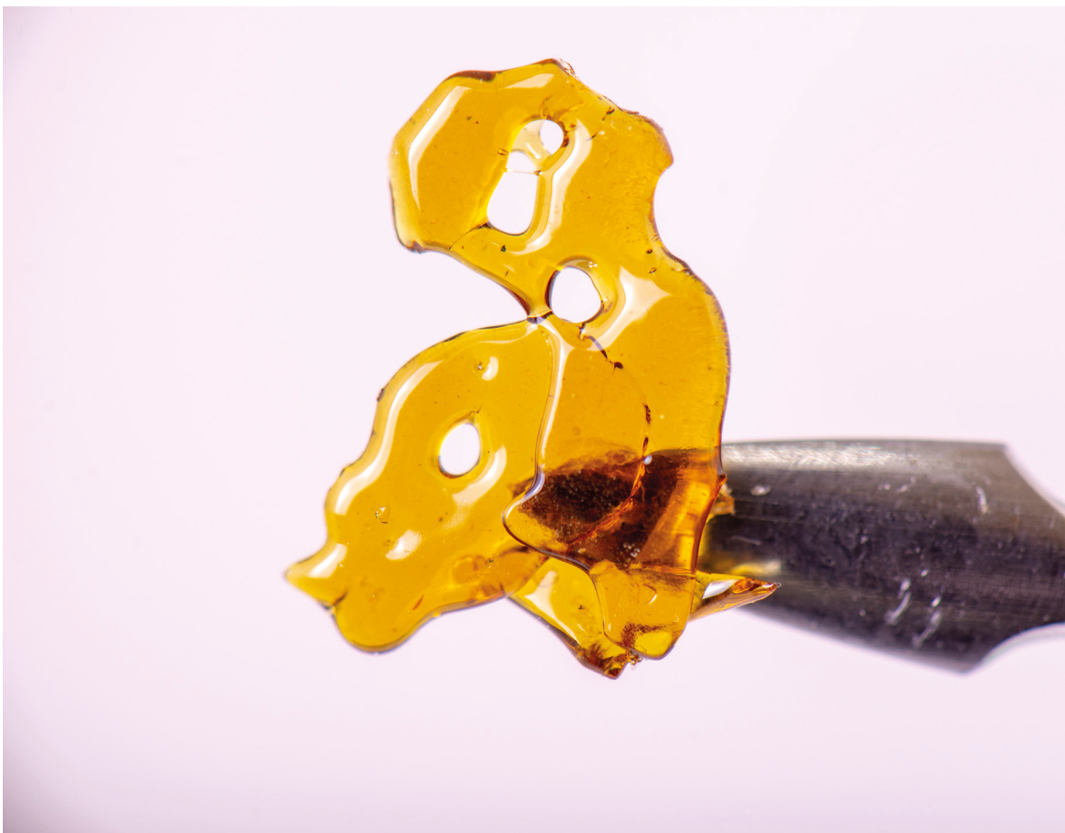
Sterk cannabisconcentraat ('dab') om te verdampen ('dabben')