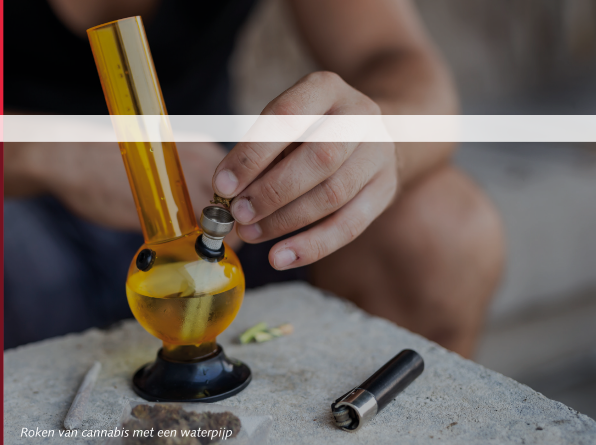
Roken van cannabis met een waterpijp