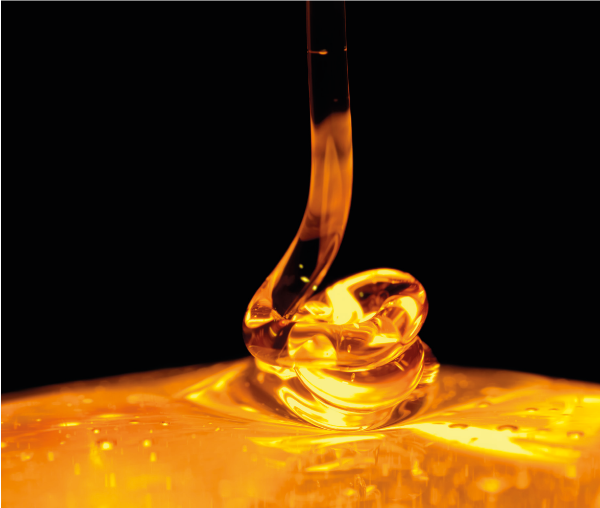
Zeer sterk cannabisconcentraat of - destillaat