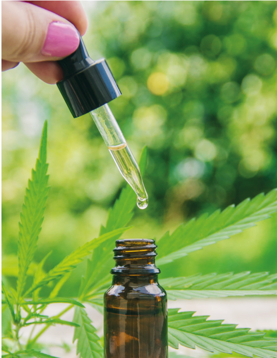
Cannabisolie om in te nemen