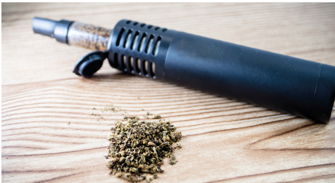
Verdampen van cannabis als plantmateriaal