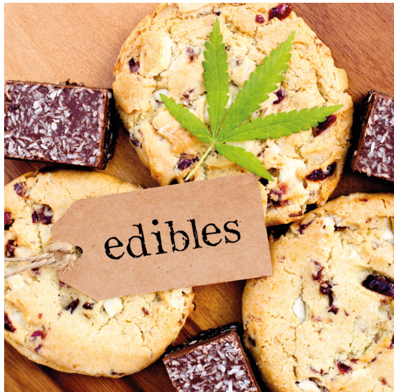
Eetbare cannabisproducten of 'edibles'