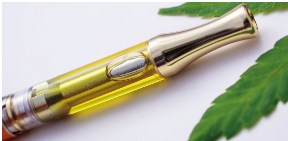
Verdampen van een cannabisconcentraat met een vapepen