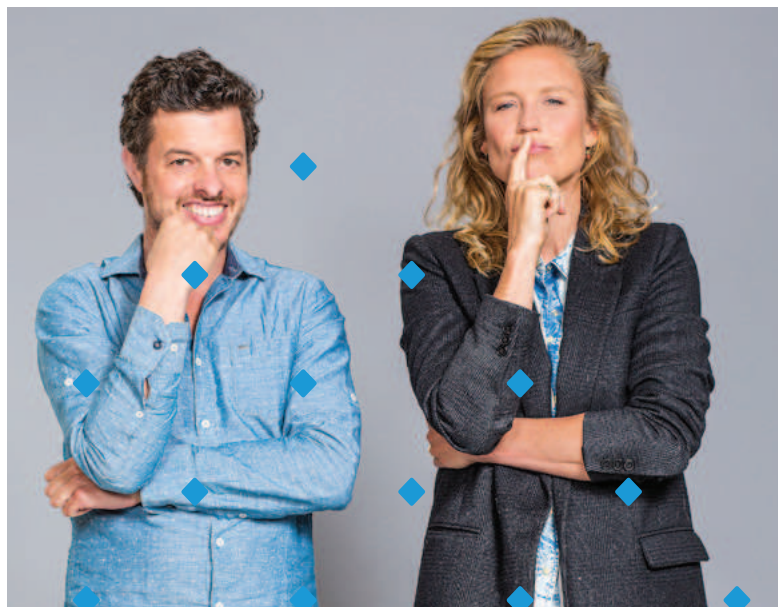
Begroting NPO 2020