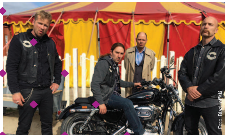
Begroting NPO 2020