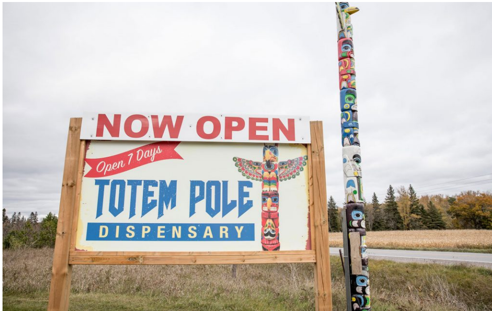
Reclame voor een cannabis-dispensary in een first-nations territory nabij Alderville, Ontario

De cannabisregulering in reservaten is in principe gelijk aan die in de rest van Canada, maar de handhaving is afwijkend. Er is een ongoing debate over zelfbestuur en juridische verantwoordelijkheden tussen federale overheid, provincie en first nations-leiders; die laatsten betwisten de bevoegdheid van federale en provinciale overheden om handhavend op te treden op hun grondgebied. Bij de politie bestaat bovendien grote terughoudendheid op dit punt, mede vanwege incidenten in het verleden. Berucht zijn de onlusten in Oka, een gemeente in Quebec, in 1990; de lokale Mohawk verzetten zich toen heftig tegen plannen om een golfterrein aan te leggen in een gebied waar zij aanspraak op maakten. De onlusten hielden maandenlang aan en werden pas na tussenkomst van het Canadese leger beëindigd. Zij kostten enkele levens, waaronder dat van een Canadese politieagent. 14