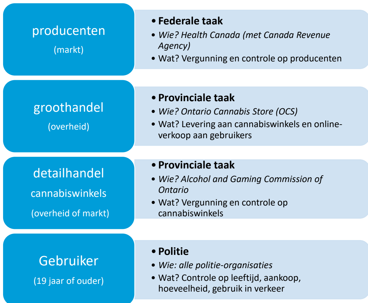
Figuur 1: Het gelegaliseerd systeem voor recreatief cannabisgebruik: wie is waarvoor verantwoordelijk?

18. Het is verboden om buiten het hier geschetste systeem om cannabis te distribueren, te produceren of te verkopen. Men mag geen equipment bezitten met als intentie om die te gebruiken voor de illegale productie of distributie. Bezit van meer dan dertig gram – in de openbare ruimte – is strafbaar. Ook is het verboden om cannabis te importeren of te exporteren (behalve voor medicinaal gebruik). Binnen Canada heeft iedereen – Canadees staatsburger of niet – dezelfde rechten, ook toeristen. De straffen variëren van een boete tot maximaal 14 jaar gevangenisstraf (in de praktijk wordt die hoge straf nooit opgelegd).