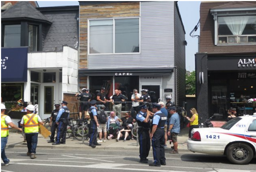
De politie sluit één van de dispensaries van de CAFE-keten in Toronto, juli 2019.

In juli 2019 bracht CBC News het verhaal over een in Toronto gevestigde dispensary-keten met de naam CAFE (Cannabis And Fine Edibles). Vestigingen daarvan zijn sinds oktober 2018 tenminste een dozijn keer gesloten, om iedere keer weer heropend te worden, meestal binnen een paar uur. Volgens de CAFE-keten zelf doen zij dit, omdat hun klanten recht hebben op een ‘ reasonable, dignified acces ’ tot cannabisproducten, terwijl de overheid faalt om daarin te voorzien. Volgens anderen is de dagelijkse opbrengst van C$30.000 tot C$50.000 per winkel een zeker zo belangrijk motief. Achter de illegale cannabisketen blijken eigenaren te zitten met een verdacht verleden; zij hebben een strafblad voor illegaal kweken van cannabis en voor fraude en namaak (counterfeiting). Voorlopig is het de overheid nog niet gelukt om de cannabisketen definitief gesloten te krijgen. 16