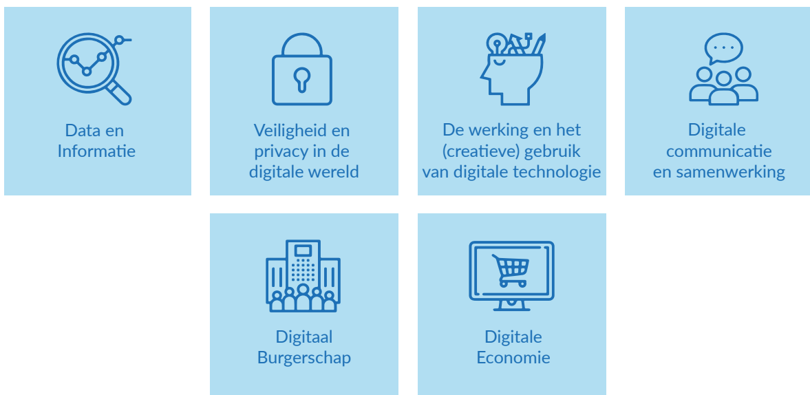
Figuur 2: Visualisatie van de grote opdrachten.