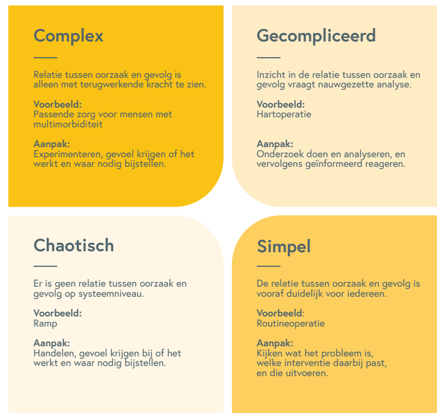
Figuur 2 Het Cynefin raamwerk

kijken wat werkt en wat niet; daar waar nodig beleid bijstellen; en zo oplossingen als het ware uit de praktijk laten opkomen (zie ook het kader hieronder).